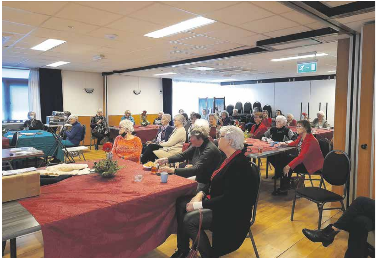
De laatste - geanimeerde - vergadering in de Tas in Benthuisen.

In de jaren 1945-1975 waren de boerinnen nog steeds goed vertegenwoordigd in de vereniging, maar het aantal vrouwen met een andere achtergrond nam toe. De leden werden ge-