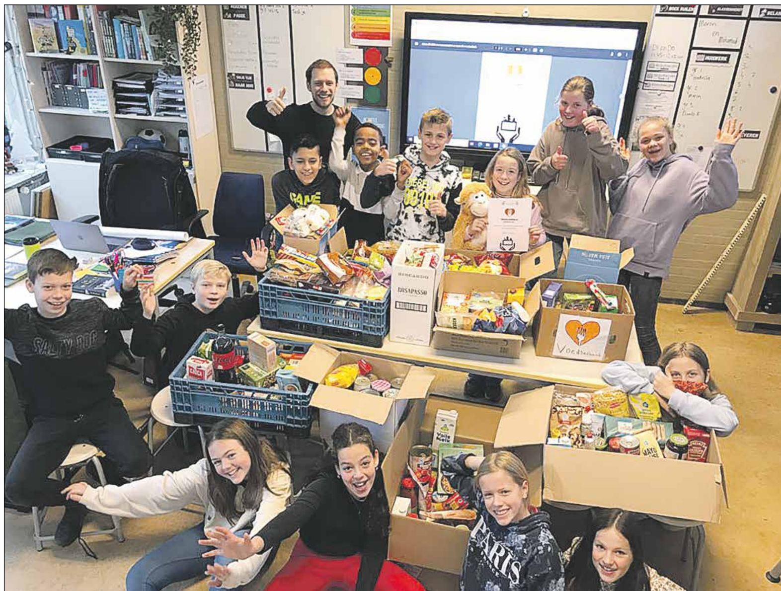
Lachende gezichten bij de al opgehaalde dozen voor de Voedselbank, maar er kan nog meer bij!

Je denkt misschien, "Oh, 6,2 %, dat is heel erg weinig". Nou, als