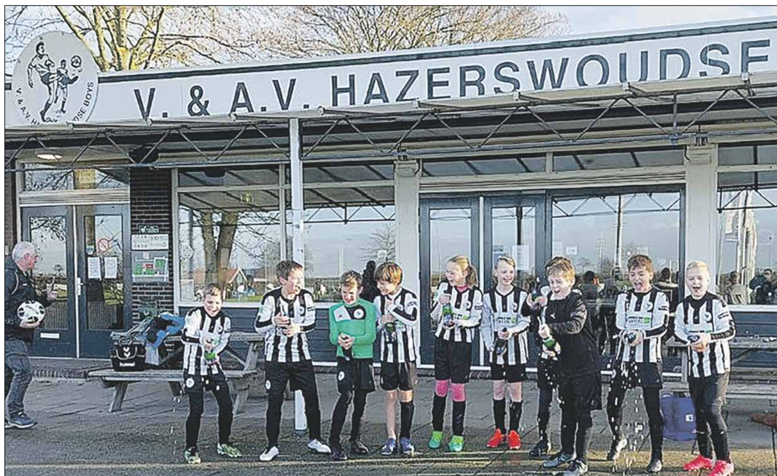
Na de kampioenswedstrijd was het tijd voor champagne!!

Het kampioenschap werd gevierd door 11 (kinder)champagneflessen te ontkurken ter beschikking gesteld door sponsor Smits Zevenhuisen.