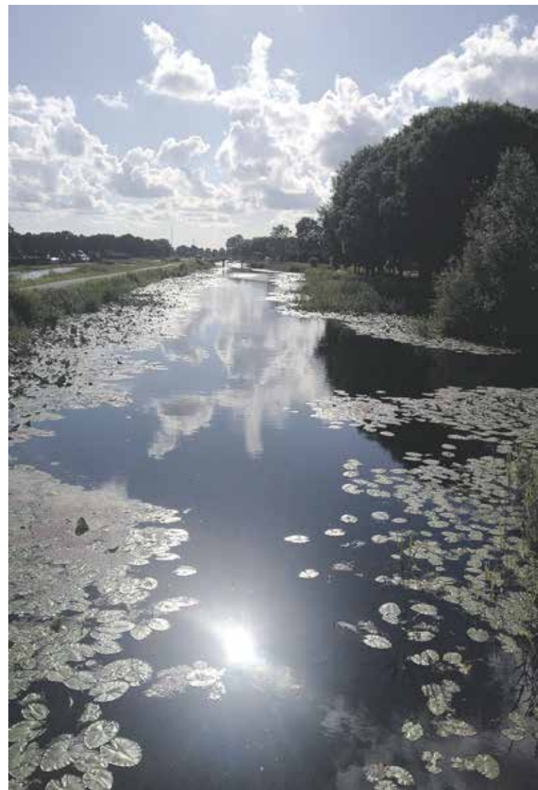
De Kerkvaart weerspiegelt een mooie herfstlucht