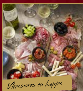
Vleeswaren en hapjes

Wij hebben volop specialiteiten en ambachtelijke rollades in huis en wij kunnen u adviseren op welke wijze u dit het beste kunt bereiden.