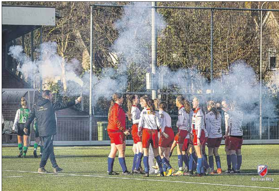
Na de wedstrijd was het "vieren", compleet met rookfakkels!

Wedstrijdverslag geschreven door Koen te Wechel.