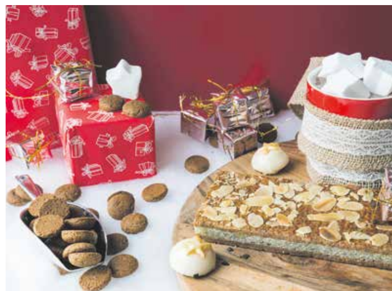
Smullen van pepernoten en gevuld speculaas.

Een typisch sinterklaasgerecht is marsepein, een deegachtig mengsel van gemalen amandelen en suiker. Je moet het eigenlijk bij de banketbakker kopen om de echte smaak te proeven. Marsepein wordt vaak gebruikt om taart te decoreren, maar in de weken voor Sinterklaas worden er poppetjes van gemaakt.