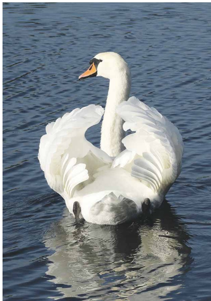
De Zwaan. Eén van onze mooiste watervogels!

0172 - 422 490 - www.kringloopalphen.nl www.kringloopazerswoude.nl