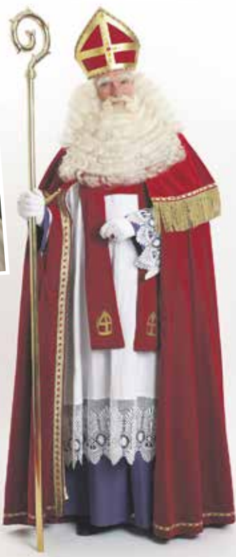
Het Sinterklaasfeest blijft onverminderd populair.