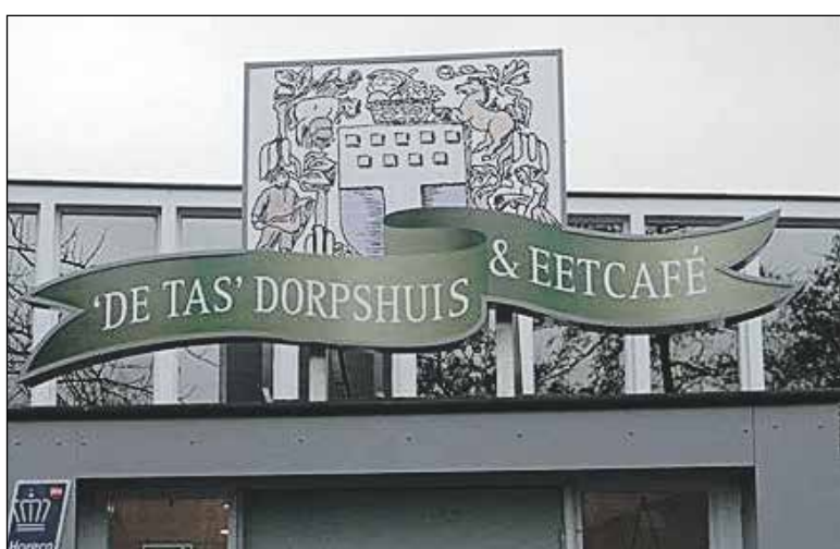
Niet alleen Dorpshuis, maar was ook een populair Eetcafé

Wie aanstaande donderdag in de gemeenteraadsvergadering zonder blikken of blozen de nota 'Uitvoering 4e fase herijking buurt- en dorpshuizen' voor kennisgeving aanneemt, moet zichzelf maar eens achter de oren krabben. Misschien is het tijd voor een ander algoritme.