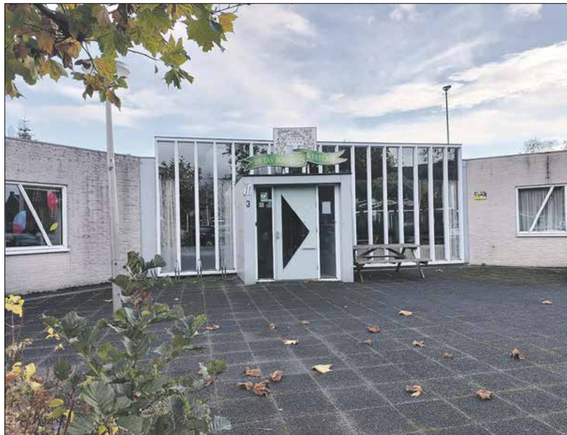
Dorpshuis De Tas Benthuizen - is de sluiting nabij??