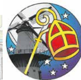
De route van de rondrit door Benthuizen