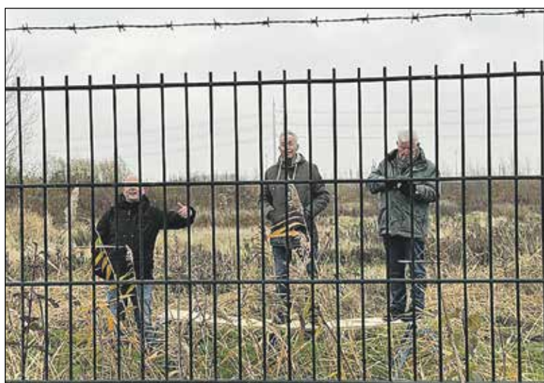
Van je supporters moet je het (maar) hebben

Hoe anders was dat afgelopen zaterdag. Twee teams met wat meer "begeleiders" dan anders, een paar trouwe supporters op een eigen gemaakte "tribune" achter het hek in de Bentwoudse bosjes en een handvol leden die net klaar waren met hun eigen thuiswedstrijd. Maar het is niet anders.