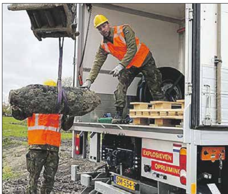
Speciaal vervoer van de bom.

Vorige maand is bij bodemonderzoek op de plek waar de woonwijk Westvaartpark in Hazerswoude-Rijndijk in aanbouw is, een vliegtuigbom uit de Tweede Wereldoorlog gevonden. Vrijdag is deze gecontroleerd tot ontploffing gebracht op het strand.