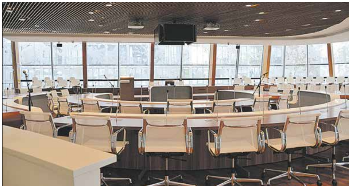
De raadszaal in het gemeentehuis... worden hier wel echte besluiten genomen?

De gemeente Alphen aan den Rijn heeft - tegen het nadrukkelijke verzoek van de gemeenteraad in - publicatie van Week in Beeld voor alle regio's louter op basis van het kostenaspect gegund aan een groot mediaconcern. Dat betekent dat het gemeentenuws binnenkort weer uit de Groene Hart Koerier verdwijnt.