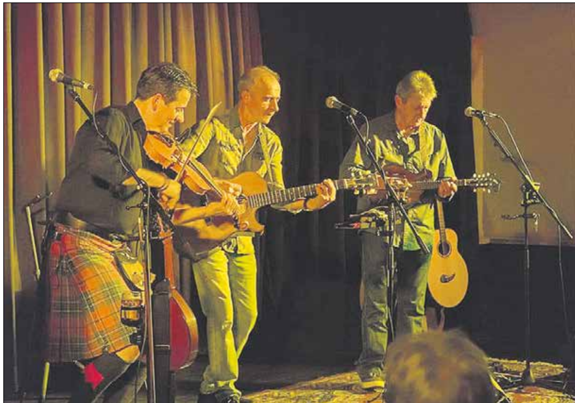
Other Roads, geconcentreerd op het podium...

Na 18 maanden zijn we weer van start gegaan met muziekconcerten in de Ridderhof. Meer dan zestig reserveringen en uiteindelijk een uitverkochte zaal met bijna 80 heel enthousiaste bezoekers. Iedereen mocht pas naar binnen na de CR-check. Dat was voor ons best spannend, maar het verliep allemaal heel soepel en gemoedelijk.