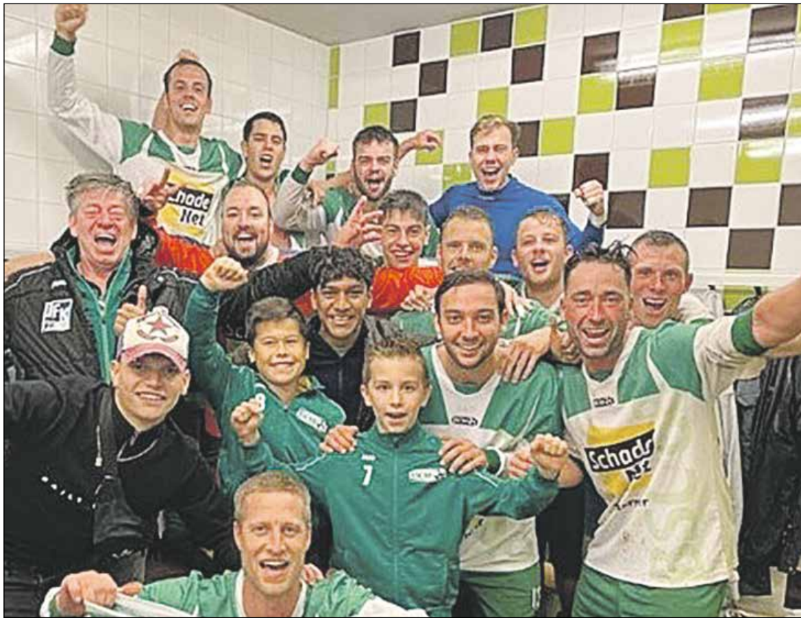
Tevreden - zeg maar lachende - gezichten in de kleedkamer na weer een prima overwinning

Afgelopen zaterdag ging het om het behoud van de koppositie in de 4e klasse D. Tegenstander TOGB uit Berkel leunde tegen de bovenste plaatsen in de competitie aan.