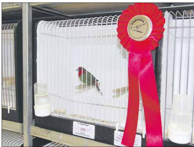
Eén van de winnende vogels.

Zoals gebruikelijk werden er vele prijzen en eervolle vermeldingen gegeven aan diverse inzenders en werd het tentoonstellingsprogramma afgewisseld met bingo en rad van avontuur.