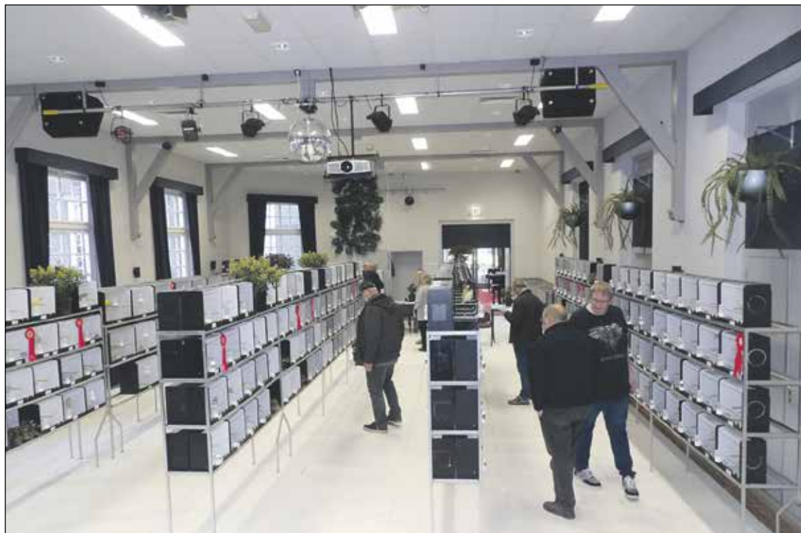
Een overzicht van de tentoonstelling

Na een periode van acht jaar, is de tentoonstelling van kooi- en volièrevogels van de vereniging Vogelvreugd Koudekerk Hazerswoude weer terug in dorpshuis De Juffrouw. De 54e Nationale Tentoonstelling werd gehouden van 28 tot 30 oktober.