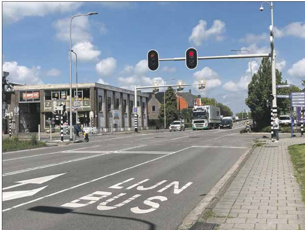
Het - inmiddels beruchte - kruispunt in Hazerswoude-Dorp gaat op de schop.