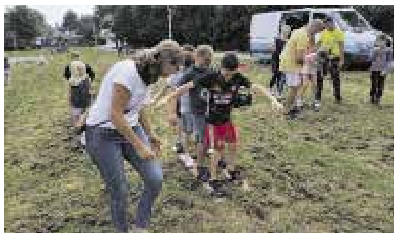
Gezellig spelletjes spelen tijdens de startmiddag