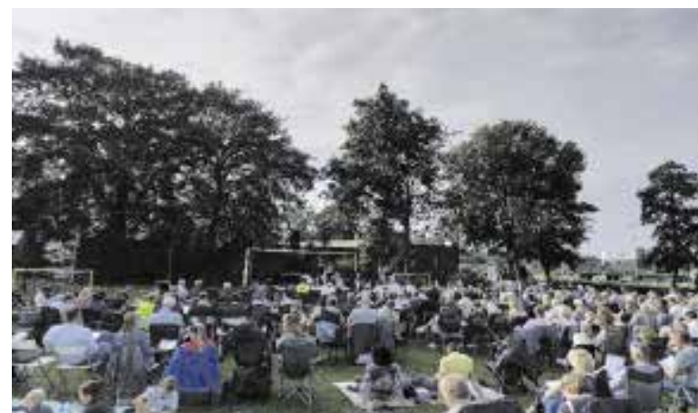
Voor de openluchtdienst bij de Hazerswoudse Boys was veel belangstelling