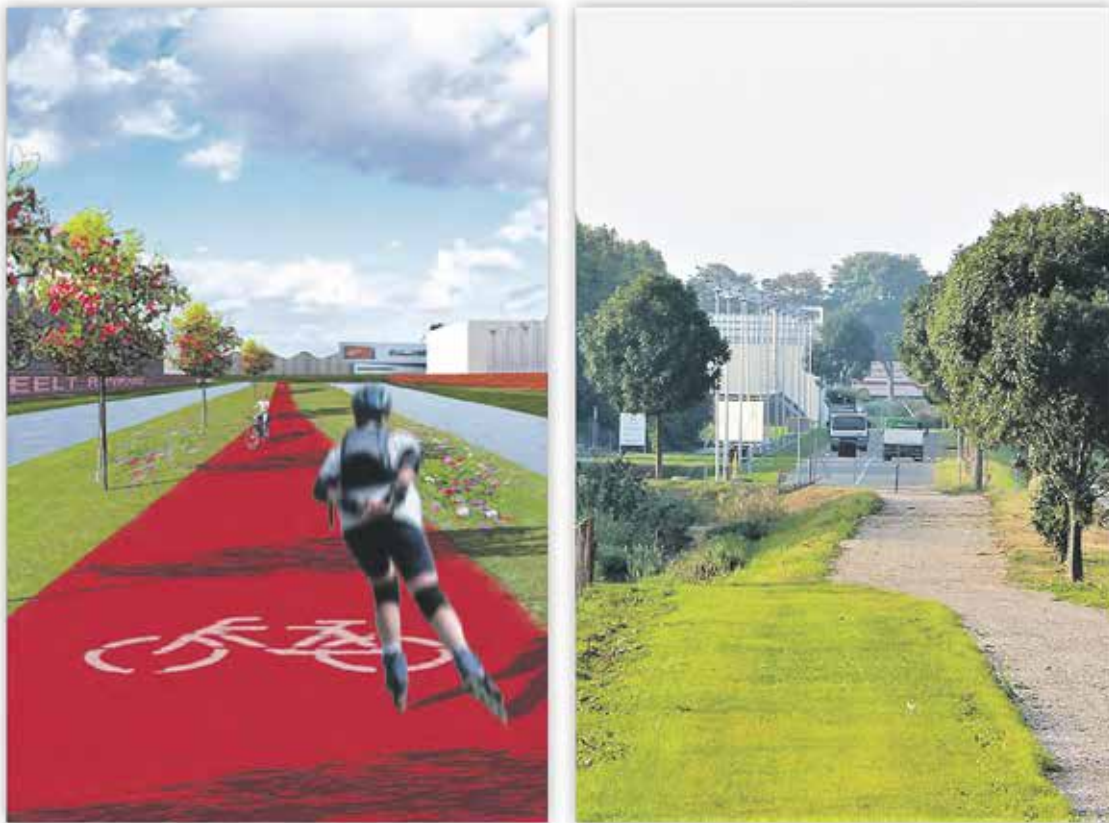
Het fietspad zoals het voorgesteld wordt en rechts de huidige situatie

Zonder enige communicatie vooraf zijn bewoners zelf gaan navragen bij aannemer en gemeente wat er ging gebeuren. Nu blijkt er een breed verbindingspad voor fietsers, bromfietsers en ruiters te komen tussen de Voorweg en de uiterste hoek van het industrieterrein en daar loopt het pad dood en komt het uit op het wegennet waar geen enkel ruimte is voor fietsers, zelfs geen fietsstrook.