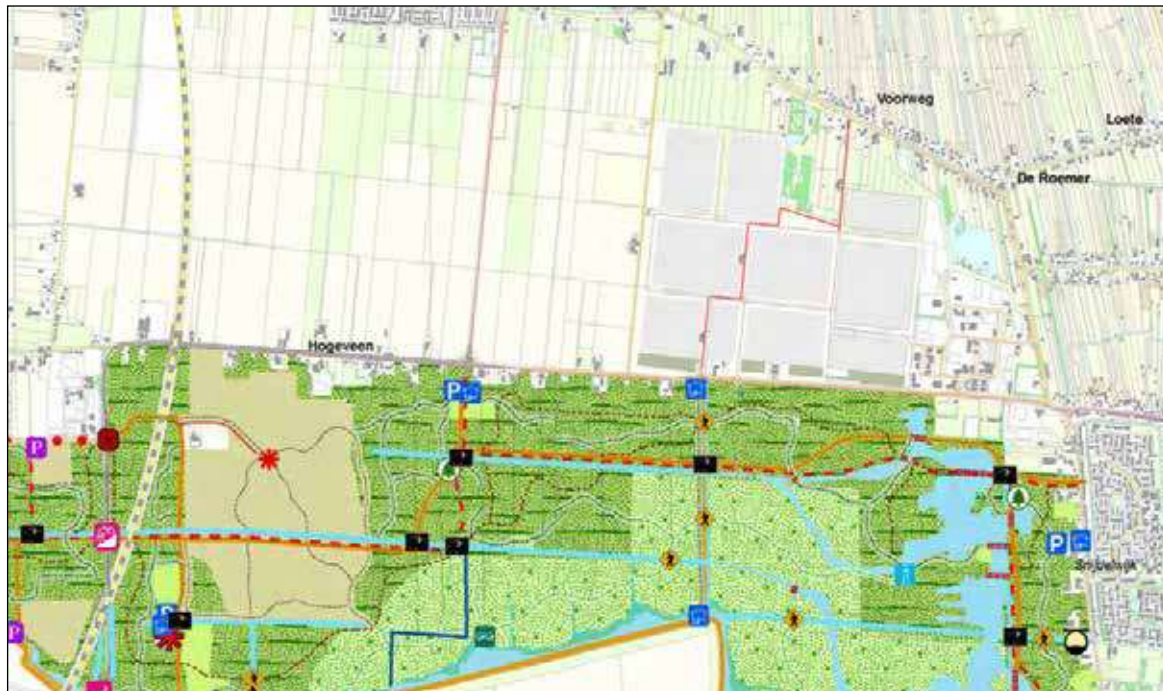
De loop van het oorspronkelijke fietspad naar het Bentwoud. Nu wordt alleen het eerste stukje aangelegd

Omwonenden krijgen nu visioenen van hardrijdende scooters tussen de fietsers door en scholieren die een korte weg naar huis kiezen, dan op een wegennet aankomen waar het verkeer wordt beheerst door zware vrachtwagens en waar het voor fietsers levensgevaarlijk is. Inmiddels is er op het industrieterrein ook huisvesting toegestaan voor arbeidsmigranten. In 2010 was daar nog geen sprake van.