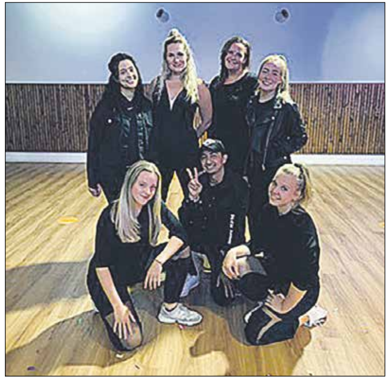
Het team van dansdocenten van Dance Departement