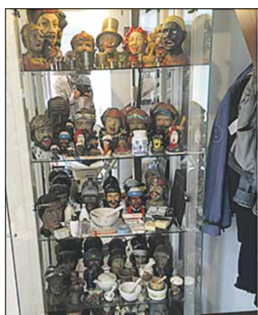
Vele herinneringen aan het drogistenbestaan!

Afgelopen donderdag werd VPTZ Aurelia verrast met een bedrag van 820,-. Natuurlijk is er nagedacht waar het bedrag aan besteed gaat worden. Vrijwilligers van VPTZ Aurelia bieden ondersteuning aan mensen in de laatste levensfase in hun vertrouwde omgeving. De vrijwilliger staat evenwichtig in het leven om te kunnen meebewegen en aan te passen aan de wensen van de zorgvrager en de naasten. Wij vinden het belangrijk dat de vrijwilligers zich gedragen voelen door de organisatie en dat zij goed toegerust zijn om aan het werk te gaan. Daarom bieden wij vrijwilligers scholing aan; een basiscursus voordat je aan de slag gaat, maar ook plannen we evaluatiemomenten in en organiseren van bijeenkomsten. Het bedrag zal dan ook ten goede komen aan de vrijwilligers zodat zij goed toegerust zijn om dit belangrijke werk te doen. Wilt u meer weten over de organisatie of vrijwilliger worden? Bel: 06-41817431 of bekijk de website www.vptzaurelia.nl Wilt u zorg aanvragen? Bel: 06-51445726