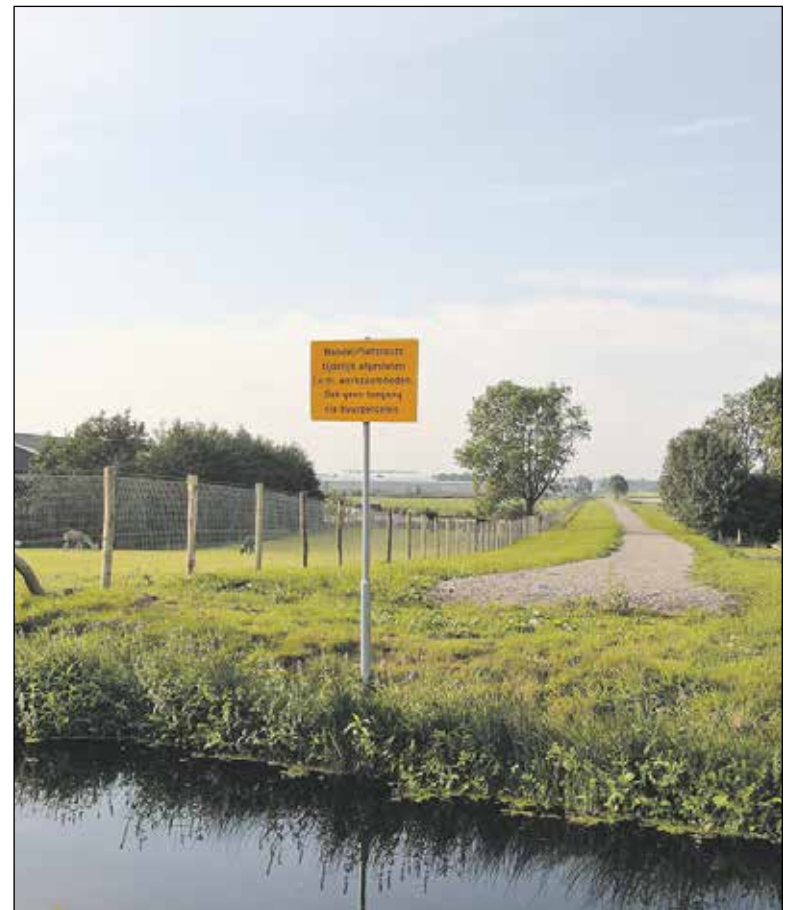
Plaats waar de brug moet komen en de aansluiting op de Voorweg