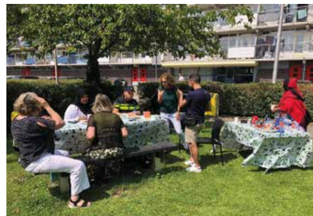
Ontmoeting met koffie en thee in het Topaasplantsoer

Ook Nuurto is vanaf het begin actief. Ze vertelt dat het werk uit meer dan alleen schoonmaken bestaat. Ze praten met bewoners, spreken jongeren aan en houden samen met andere buurtouders een oogje in het zeil. Ook hebben ze goed contact met de huismeester en de wijkagent zodat problemen snel aangepakt kunnen worden. Ze hebben een