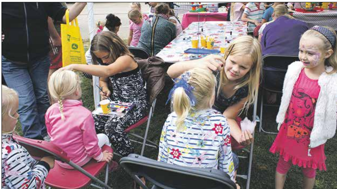
'Uit de oude doos' - Zouden ze nog lang zo mooi hebben rondgelopen?

De kinderuitmarkt aan de Da Costasingel in Hazerswoude-Rijndijk