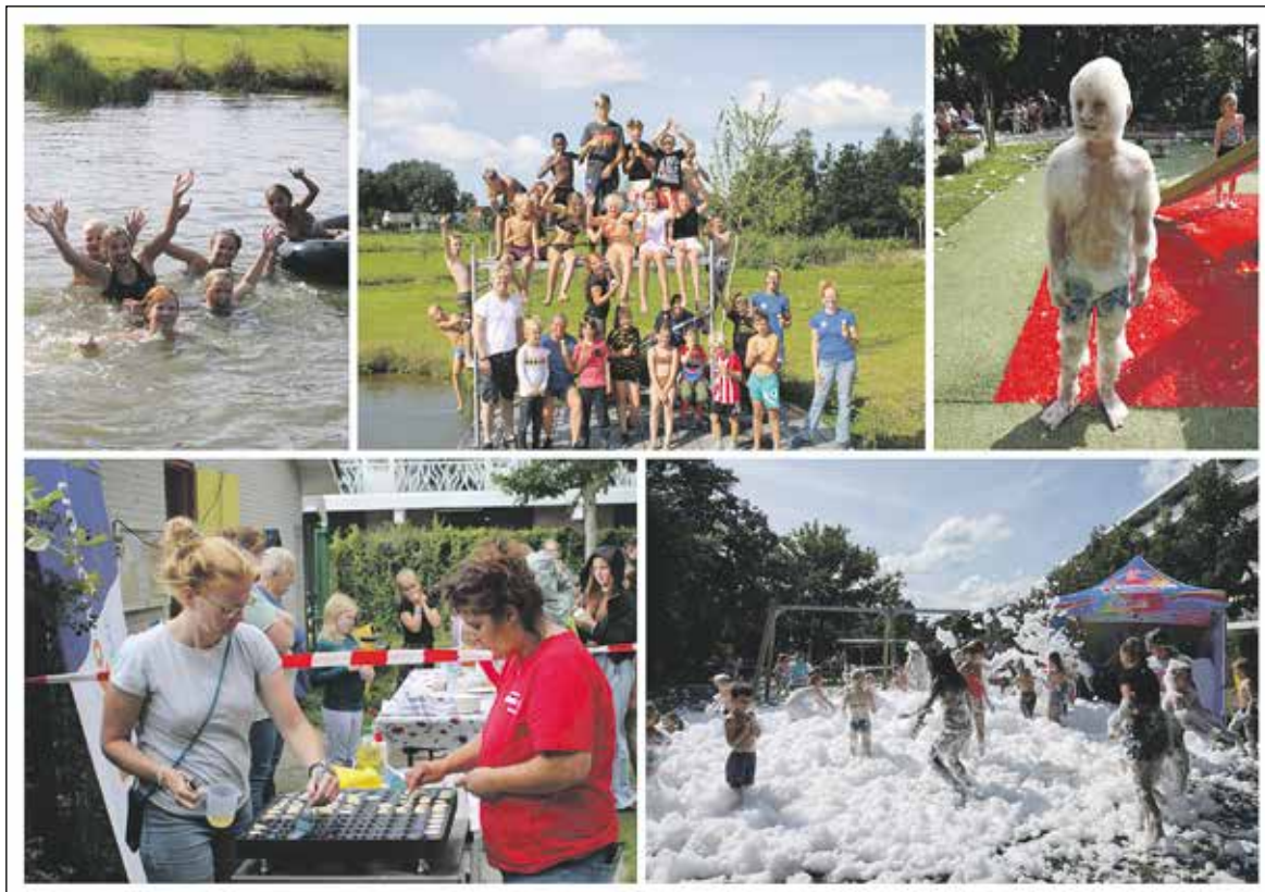
Schuimparty in Speeltuin de Rode Wip

Dit jaar was er geen huttenbouw vanwege corona. Een tentenkamp en vele andere sportieve, creatieve en spannende activiteiten maakten het toch weer een onvergetelijke laatste week van de schoolvakantie.