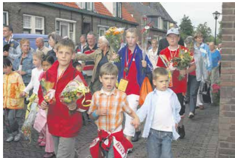
Veel deelnemers staan al klaar!

uur is er een voorinschrijving op de Johannes Postschool en de Springplank. Op het plein kunt u uw kind(eren) en uzelf of anderen inschrijven. Op de St. Michaëlschool krijgen de leerlingen intern nog bericht over hoe ze zich in kunnen schrijven. Op woensdag 8 September zal het voor iedereen in het dorp ook mogelijk zijn