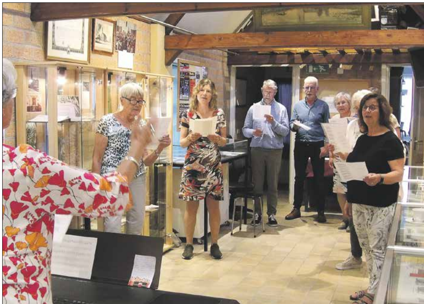
Het Hazerswouds Dorpslied werd gezongen door een deel van de cantorij van de Korenaar

Er is dit jaar nog geen jaarmarkt en geen activiteiten daar omheen, maar in het Historisch Museum werd wel een nieuwe expositie geopend op 27 augustus. Een tentoonstelling over koren in Hazerswoude.