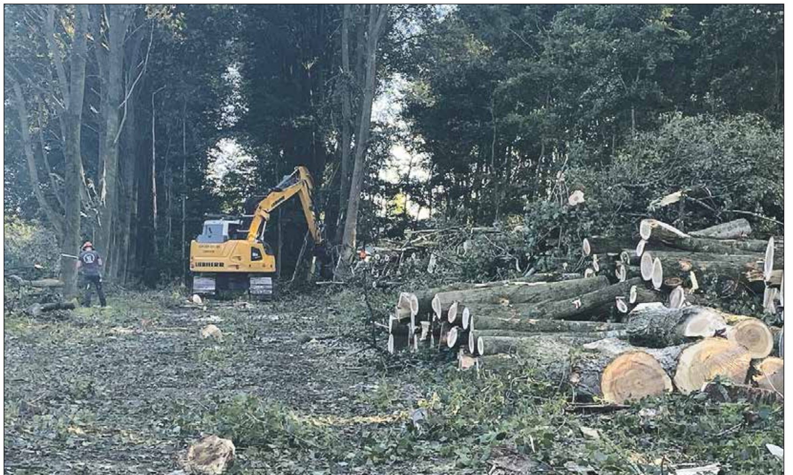
Het lijkt wel of er een bos als op de Veluwe wordt omgekapt!

In de bosjes staan met name populieren en essen. De populieren hebben de leeftijd bereikt waarop zij gekapt moeten worden, omdat zij kunnen omvallen. De essen worden vanwege de ziekte 'essentaksterfte' gekapt. Aangetaste bomen zijn onveilig en kunnen ineens omvallen. Al eerder is het essen bosvak langs de Oostvaart geruimd en met andere variëteiten ingepland, zoals eik, linde, berk en wilde kers. Kras: "Het oude beleid van Staatsbosbeheer was om de productiebosjes eens in de 30 jaar helemaal te ruimen en opnieuw aan te planten. We gaan dat niet meer op dezelfde wijze herhalen, maar maken nu van de gelegenheid gebruik om een andere aanplant- en beheerwijze in te voeren." Als resultaat heeft Staatsbosbeheer op de lange termijn toekomstbestendige en soortenrijkere bosvakken voor ogen, met daarin een variatie aan bomen zowel in soort als in leeftijd. "Met de boswerkzaamheden die nu plaats vinden is dit het moment om een stap