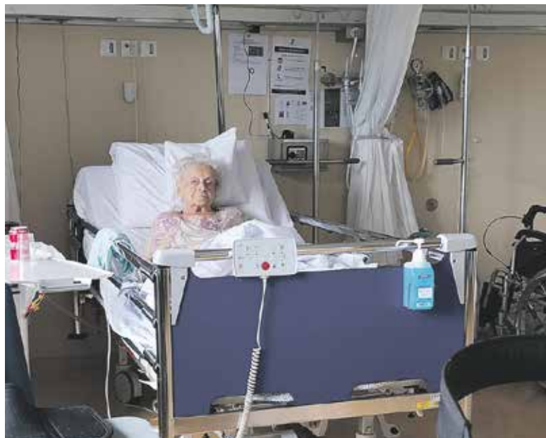
98 jaar en alleen in een ziekenhuisbed...

Zorgen om de zorg voor oudere alleenstaanden