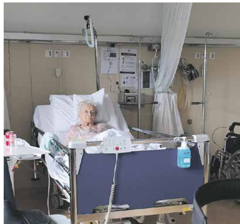
98 jaar en alleen in een ziekenhuisbed...