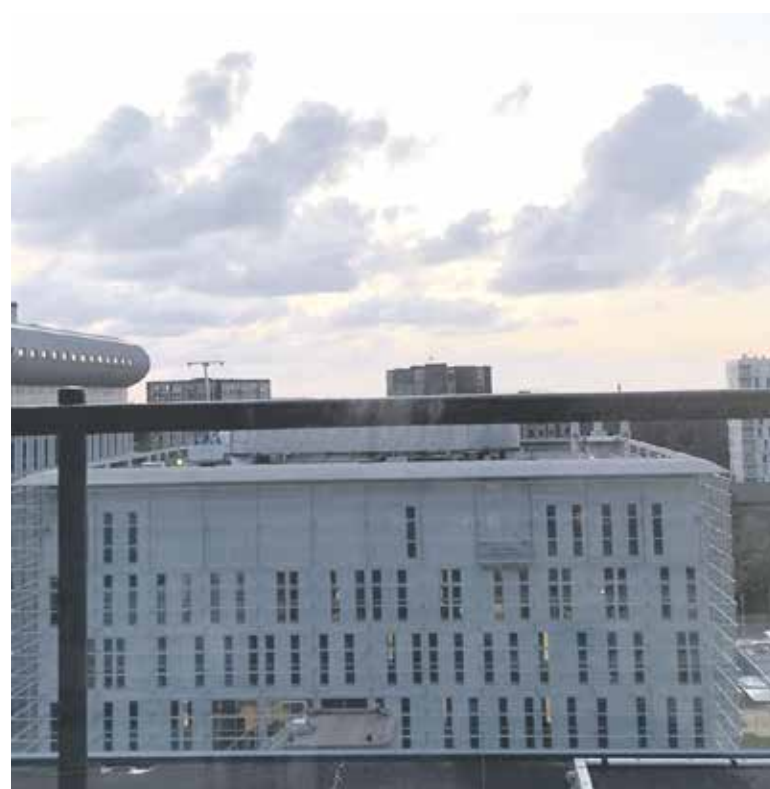
Donkere wolken boven een ziekenhuis