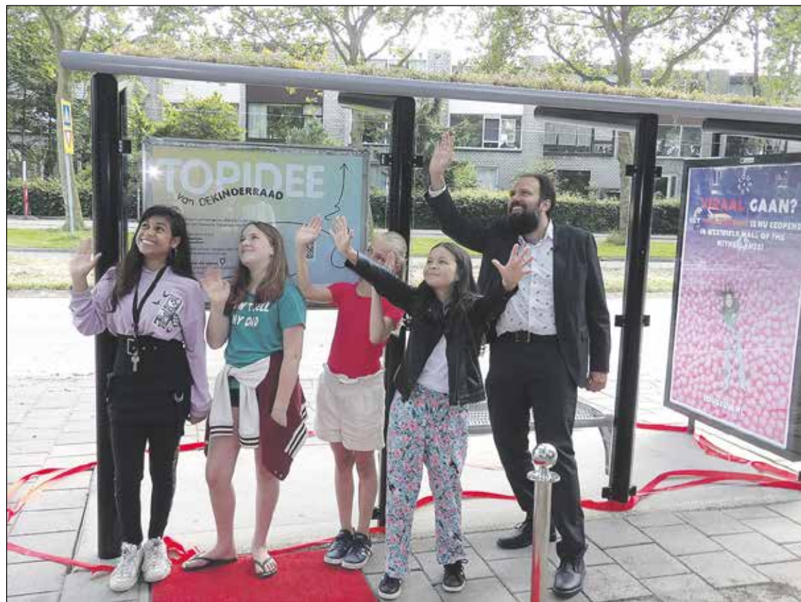
Met recht een TOPIDEE