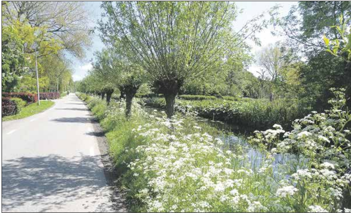
Zo mooi en schoon is Koudekerk

Op zaterdag 17 juli a.s. was er is weer een zwerfvaljutactie in Koudekerk. Door een aantal vrijwilligers werd op allerlei plaatsen in Koudekerk zwerfafval opgepikt met de bekende afvalknijpers.