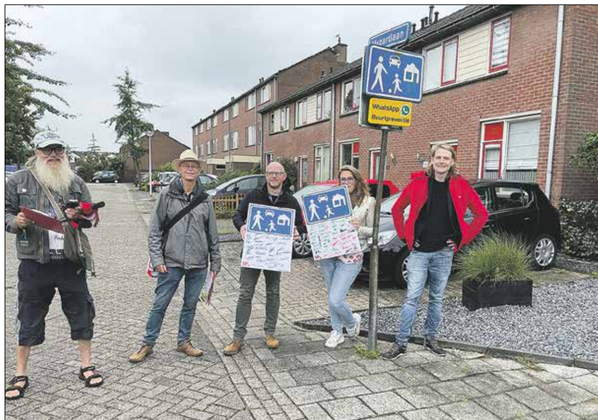
De initiatiefnemers van de handtekeningen actie

Buurtbewoners Mozartlaan bieden samen met SP verzamelde handtekeningen tegen hardrijders op woonerf aan bij de gemeenteraad.