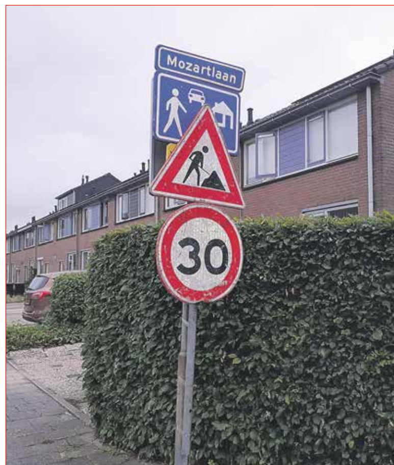
Mag je alleen tijdens de werkzaamheden 30 km/u of ....

met extra waarschuwingen. Er zitten een aantal speeltuintjes in de straat, dus het is een vergelijkbare situatie. De bewoners zijn bereid om mee te denken, maar willen niet de rekening voor het gebrek aan veiligheid in de straat op hun bord krijgen. De gemeente moet volgens hen snel over de burg komen met maatregelen.