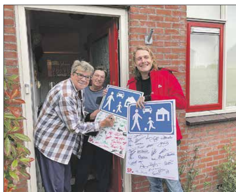
Enthousiast plaatste men handtekeningen...