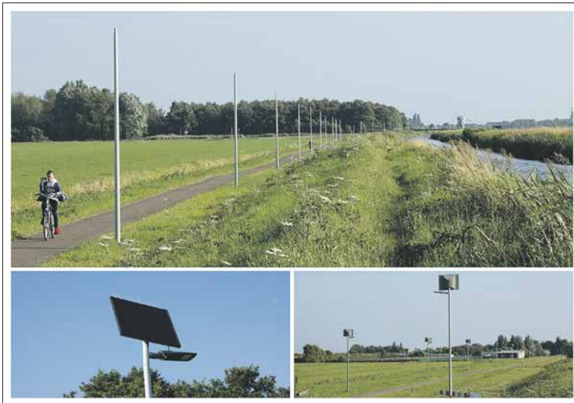
Richting Hazerswoude-Dorp zijn de zonnepanelen en LED lampen al bevestigd. Bij Hazerswoude-Rijndijk zijn vorige week de palen geplaatst en wordt het werk komende tijd nog afgemaakt.

Al sinds jaar en dag doet men het hier zonder verlichting. Van enig recent ongeval, ongewenste of gevaarlijke situatie in het donker als aanleiding voor het aanbrengen van het verlichtingslint is bij de Groene Hart Koerier in elk geval niets bekend. Ook zijn geen dringende verzoeken van inwoners in de omgeving bekend om ervaren onveiligheid te bestrijden. Het gaat ook niet om een fietspad dat je persé MOET gebruiken als het in de winter 's ochtends nog donker is en je gaat naar school of werk. Er zijn immers ver-