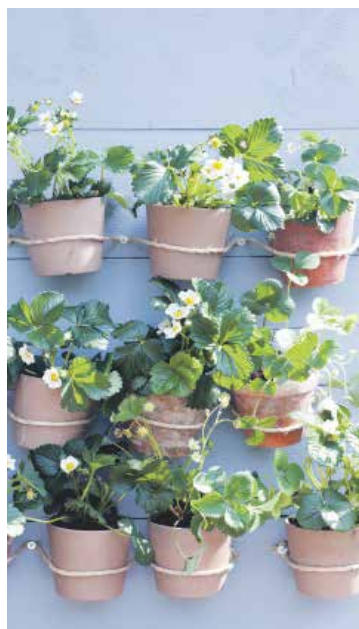
Bloeiende planten aan de wand.

Naar schatting 75% van de Nederlandse huishoudens heeft een balkon of terras. Een plek waar het met lente- en zomerzon prima vertoeven is. Aan de vooravond van het nieuwe buitenzitseizoen heeft Mooi-watplantendoen.nl een onderzoek gehouden onder balkon- en terrasbezitters. Belangrijkste conclusie: planten zijn sfeerbepalend op balkon en terras. Daarnaast blijkt Nederland redelijk tevreden over eigen balkon of terras, ook verticaal te tuinieren en een duidelijke voorkeur voor bloeiende planten te hebben.