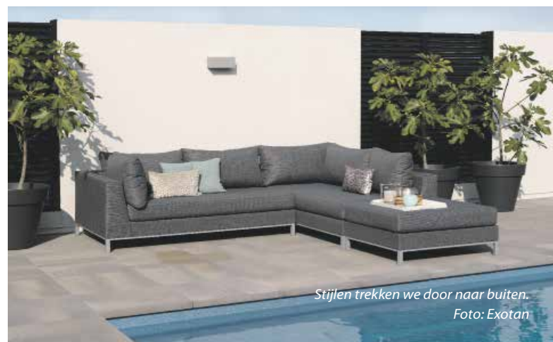
Stijlen trekken we door naar buiten.

merse tint waar je meteen vrolijk van wordt. Lang leve het sfeervolle buitenleven!