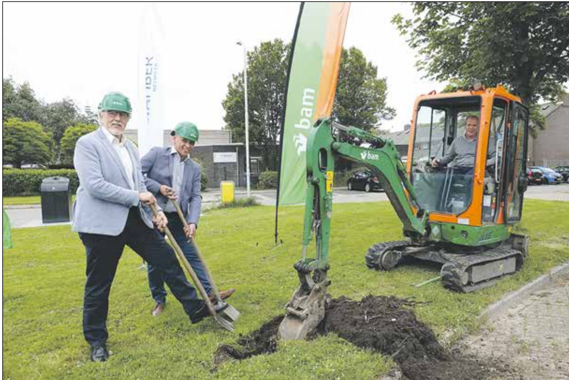
De eerste schop gaat de grond in voor het flinke project.

In aanwezigheid van de dorpsverleggen, de ambassadeurs die het glasvezelproject onder de aandacht van inwoners brachten, de aannemer BAM, DELTA Fiber Netwerk en wethouder Schotanus werd vorige week symbolisch de eerste schop in de grond gezet met graafmachine en spades.