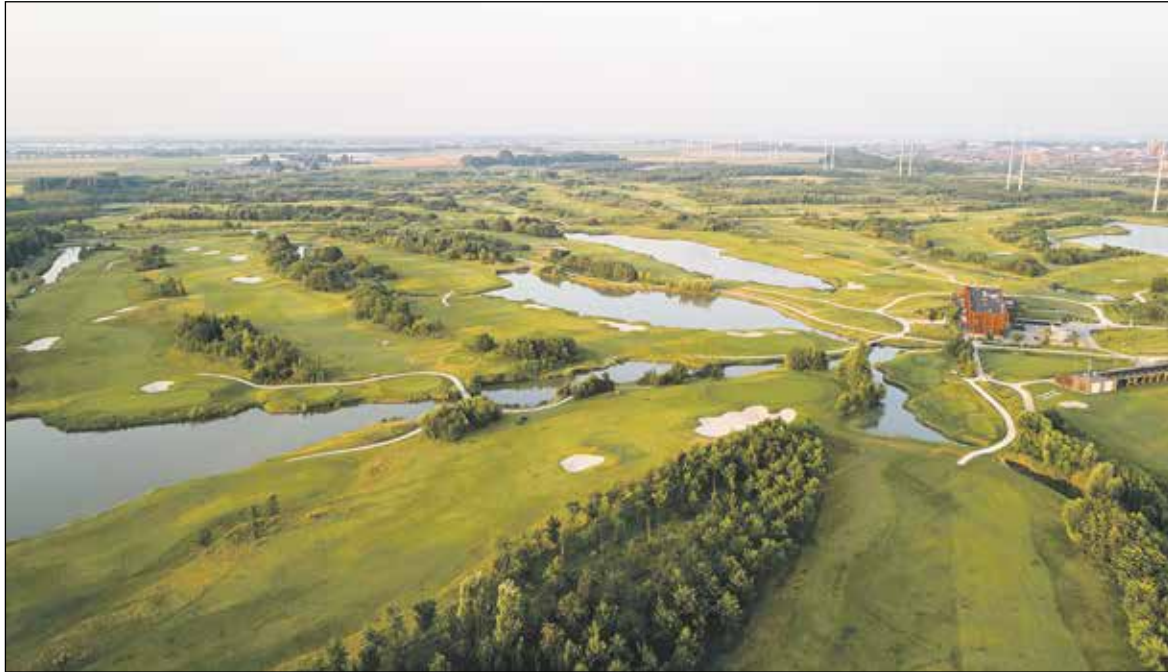
Een luchtfoto met overzicht van Golfbaan Bentwoud

Op 25 juni 2011 werd de eerste ronde gegolft op de Par 3/4 baan van Golfbaan Bentwoud. Nu, 10 jaar later, viert de 36 holes golfbaan in Benthuizen haar eerste jubileum tijdens een speciale jubileumweek. Voor iedereen valt er deze week genoeg te beleven.