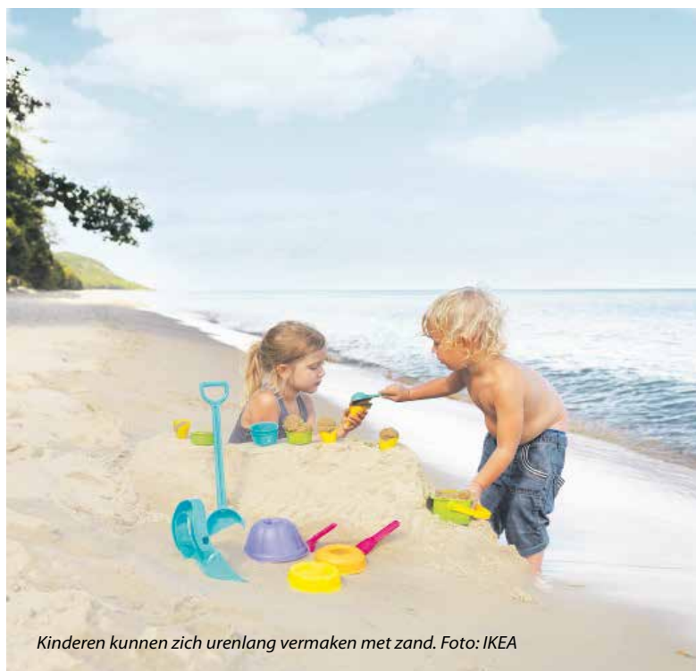
Kinderen kunnen zich urenlang vermaken met zand.