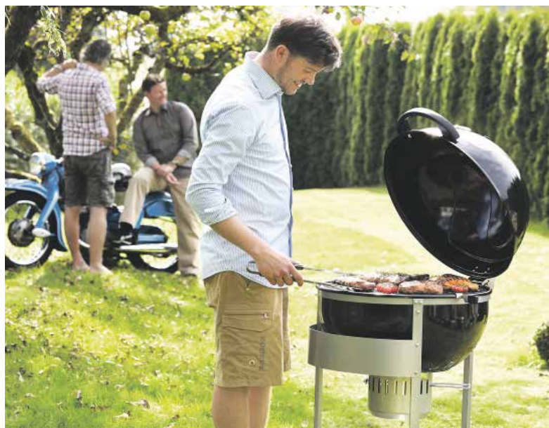
Geen gedoe met houtskool als je kiest voor een gasbarbecue

Planten sfeerbepalend op balkon en terras