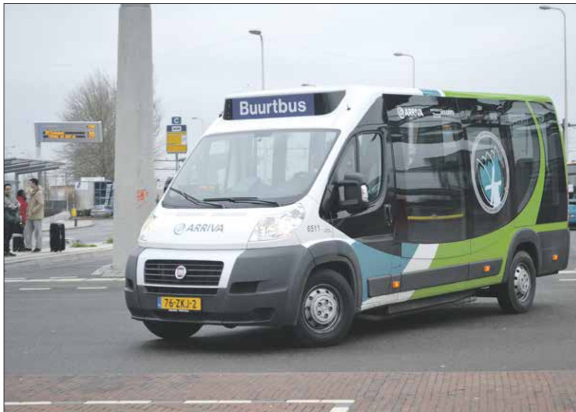
De Buutbus zoals hij reeds in Boskoop e.o. rijdt...