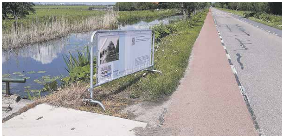
Een promotiebanner voor de fietstocht staat al in Benthuizen langs de route!