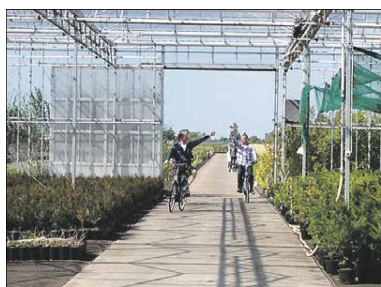
Dwars door een kas fietsen!