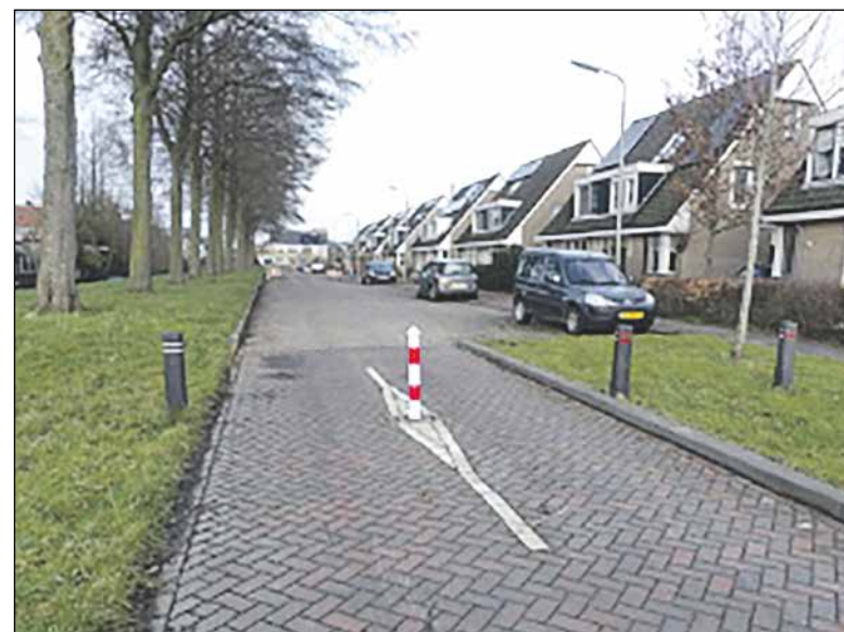
Het gewraakte paaltje...

de bevinding gekomen dat er nooit verkeersbesluiten over "Het Paaltje" ter inzage zijn gelegd of genomen terwijl dat voor de plaatsing van een paaltje wel vereist is. Ook afspraken met direct omwonenden over "Het Paaltje" lijken niet formeel gedocumenteerd te zijn. Dat zijn ontstellende conclusies, die tijdens de vergadering met de raadsleden en de wethouder werden gedeeld. Wethouder van Velzen meende zich uit zijn Rijnwoudse tijd wel te herinneren dat het College van B&W en de raad tot een paaltje hadden besloten, maar daar bleef het bij.