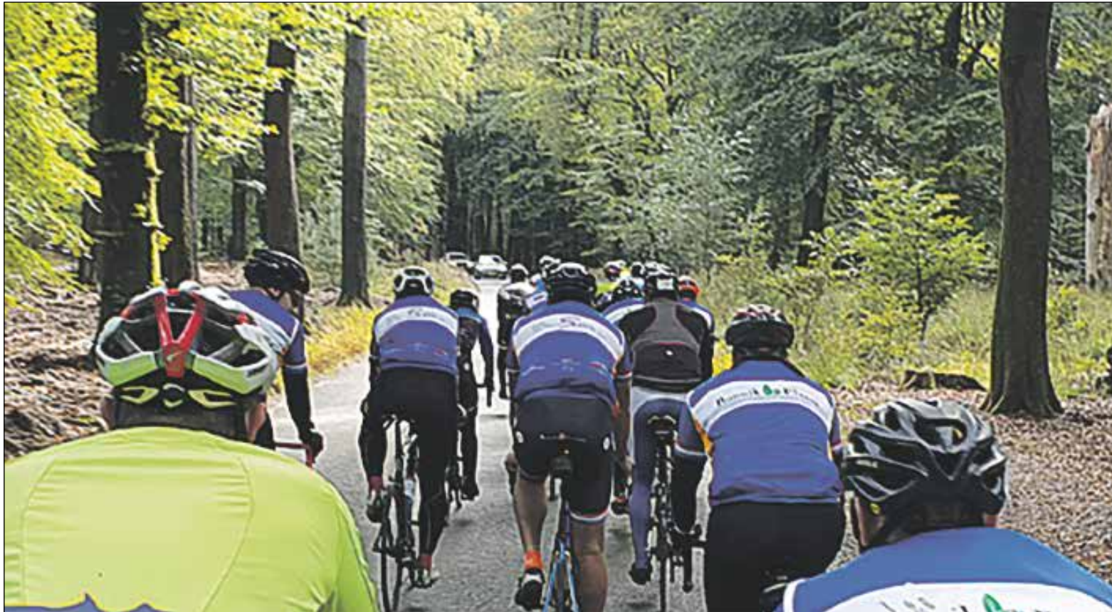
Ook door de bossen van de Urechtse Heuvelrug gaan ze er tegenaan!

Zaterdag 12 juni is het zover. Ruim 60 fietsers en begeleiders uit de regio Hazerswoude leggen 'op de langste dag' een afstand af van 330 km door de provincie Utrecht. Elke gesponsorde kilometer-euro komt 100% ten goede aan de Antoni van Leeuwenhoek Foundation. Dus sponsor mee!