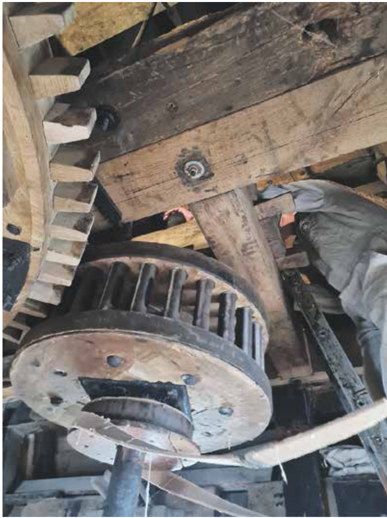
Het maalwerk van Nieuw Leven

Tot voor kort werd er in de molen alleen maïs gemalen dat diende als veevoer. Maar dankzij de expertise en het harde werk van onze molenaars kunnen we sinds enige tijd weer zelf tarwegraan malen voor de verkoop in de molenwinkel. Als eerste stap in het maalproces zetten de molenaars de molen 'op de wind'. Vervolgens worden, indien nodig, de wieken opgezeild. Wanneer de wind verandert, passen de molenaars ook de zeilvoering aan. Zodra boven in de molen de kammen handmatig in het houten wiel zijn gezet, kan het malen beginnen.