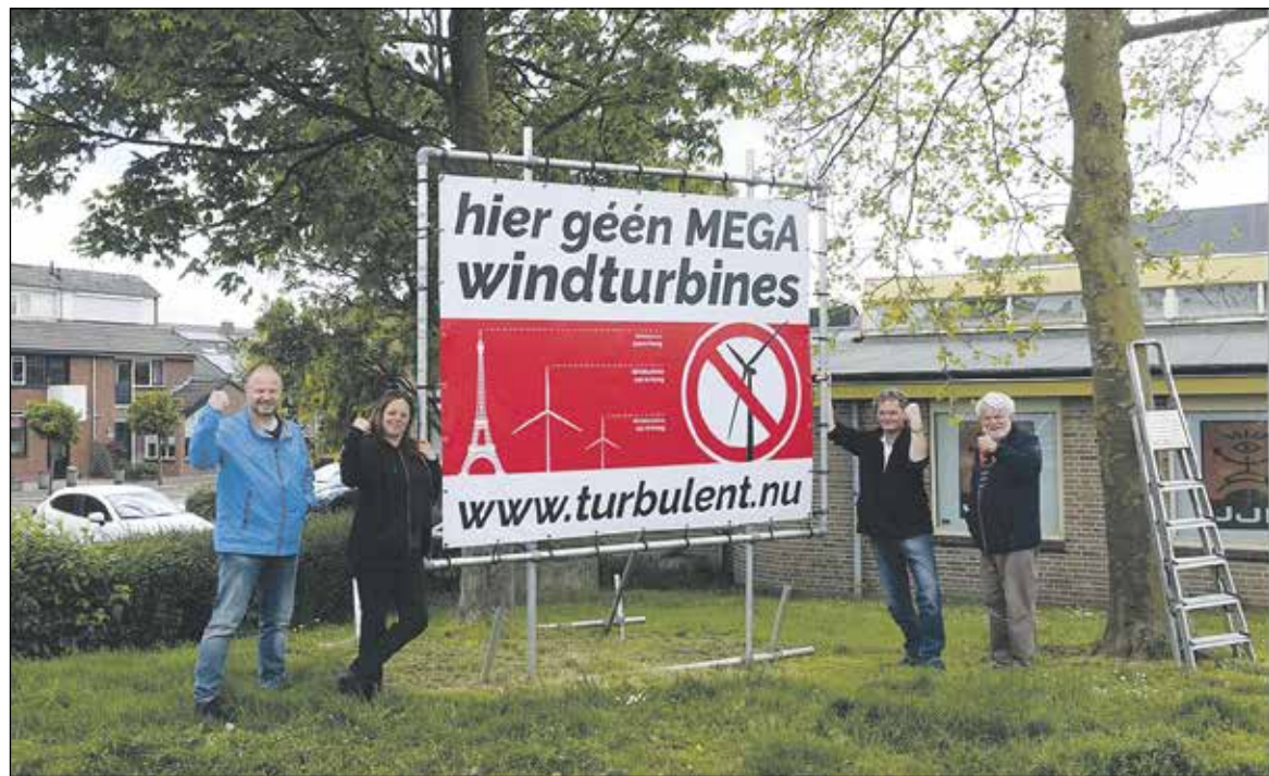
Leden van Turbulent hebben het een spandoek opgehangen langs de Rijndijk bij Het Anker

De projectgroep Turbulent heeft in de afgelopen weken al bijna 2.000 handtekeningen verzameld met hun petitie tegen windmolens langs de N11 bij Hazerswoude-Rijndijk. Zij kregen afgelopen donderdag bijval van een aantal politieke partijen.