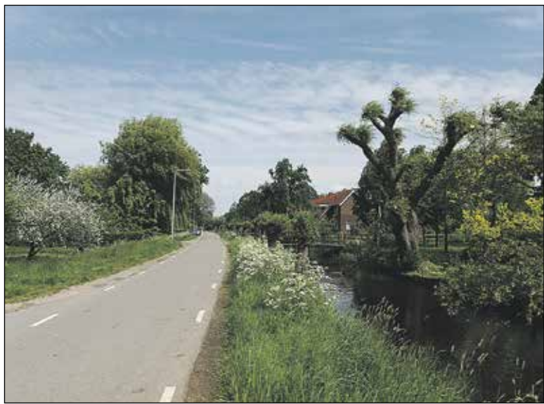
Lagewaard in 2021