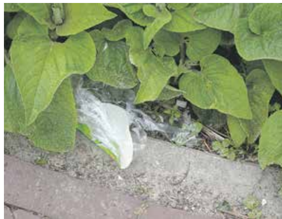
Plastic zwerfafval in struiken

Op zaterdag 15 mei a.s. is weer een zwerfafvalactie in Koudekerk. Het oud papier wordt die zaterdag door Aspasia opgehaald en dat is een goede aanleiding om onze woonomgeving zwerfafvalvrij te maken.