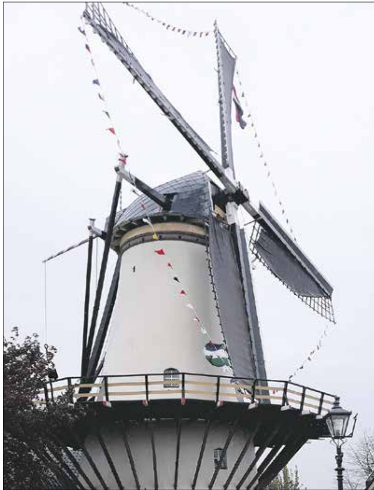
Molen de Haas in feesttooi

Inmiddels is ruim 60 % van het streefbedrag van € 5.000,- bij het Molenfonds binnen gekomen. De actuele stand bekijken of een bijdrage doneren, kan op