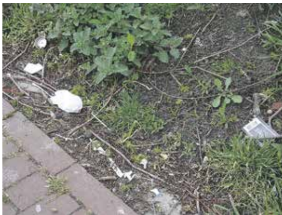
Zwerfafval bij containerplek