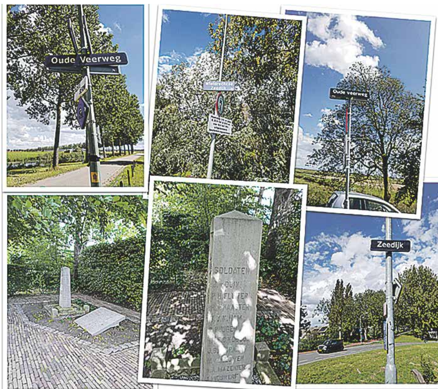
De omgeving van Dubbeldam (nu Dordrecht) met de straatnamen waar fel werd gevochten

sloot de luitenant de actie af te blazen en terug te trekken. Vijf doden, twee ernstig gewonden en een aantal licht gewonden was een gevoelig verlies.