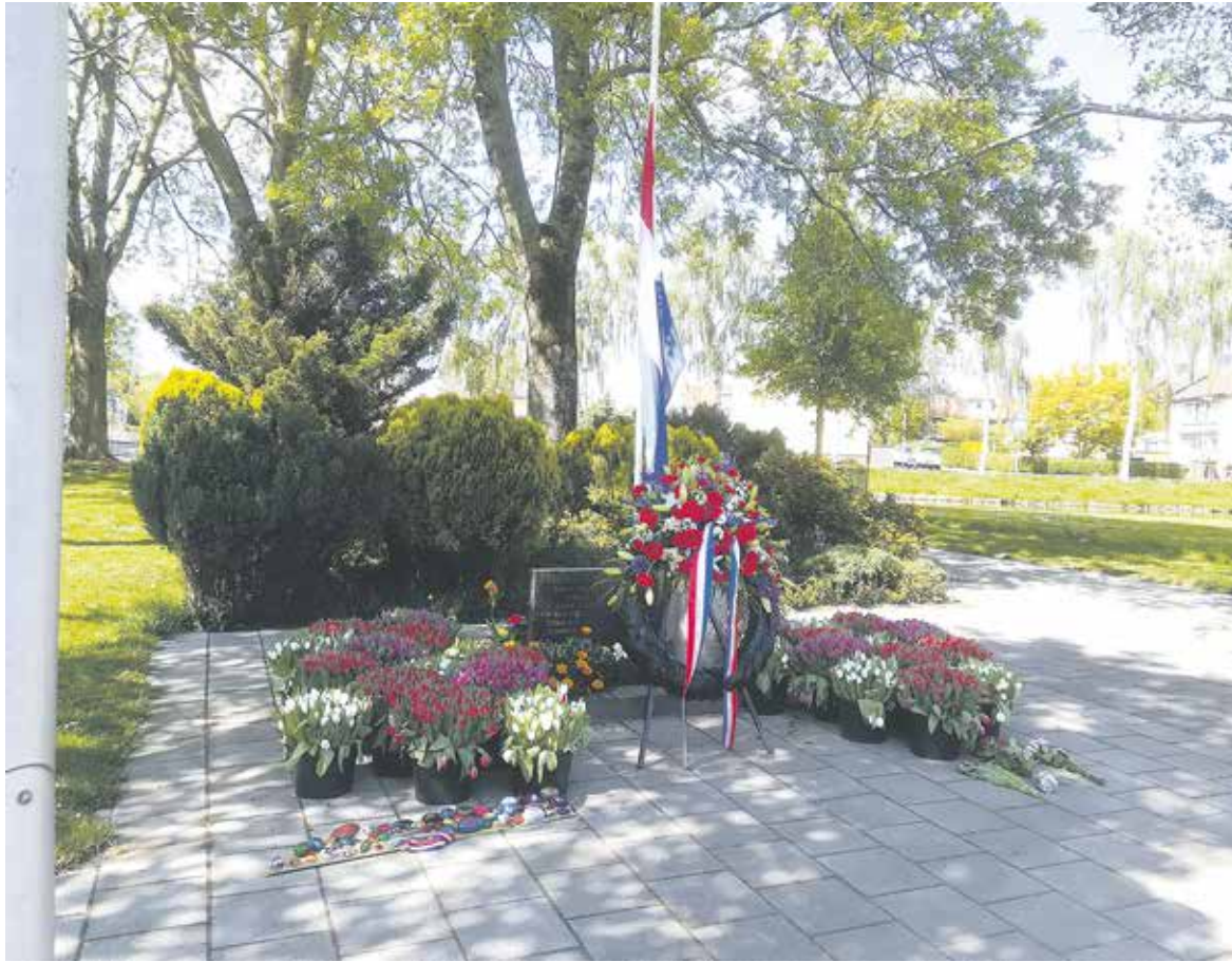
Bij de foto: Het monument aan de Bilderdijklaan in Hazerswoude-Rijndijk in 2020. Het was toen een van de 75 monumenten die uitverkozen was voor een ware bloemenhulde.

Het lijkt een vanzelfsprekendheid elk jaar: Koningsdag met vrijmarkten en spellen, de Dodenherdenking op 4 mei, 5 Mei festiviteiten zoals de Libertytour.