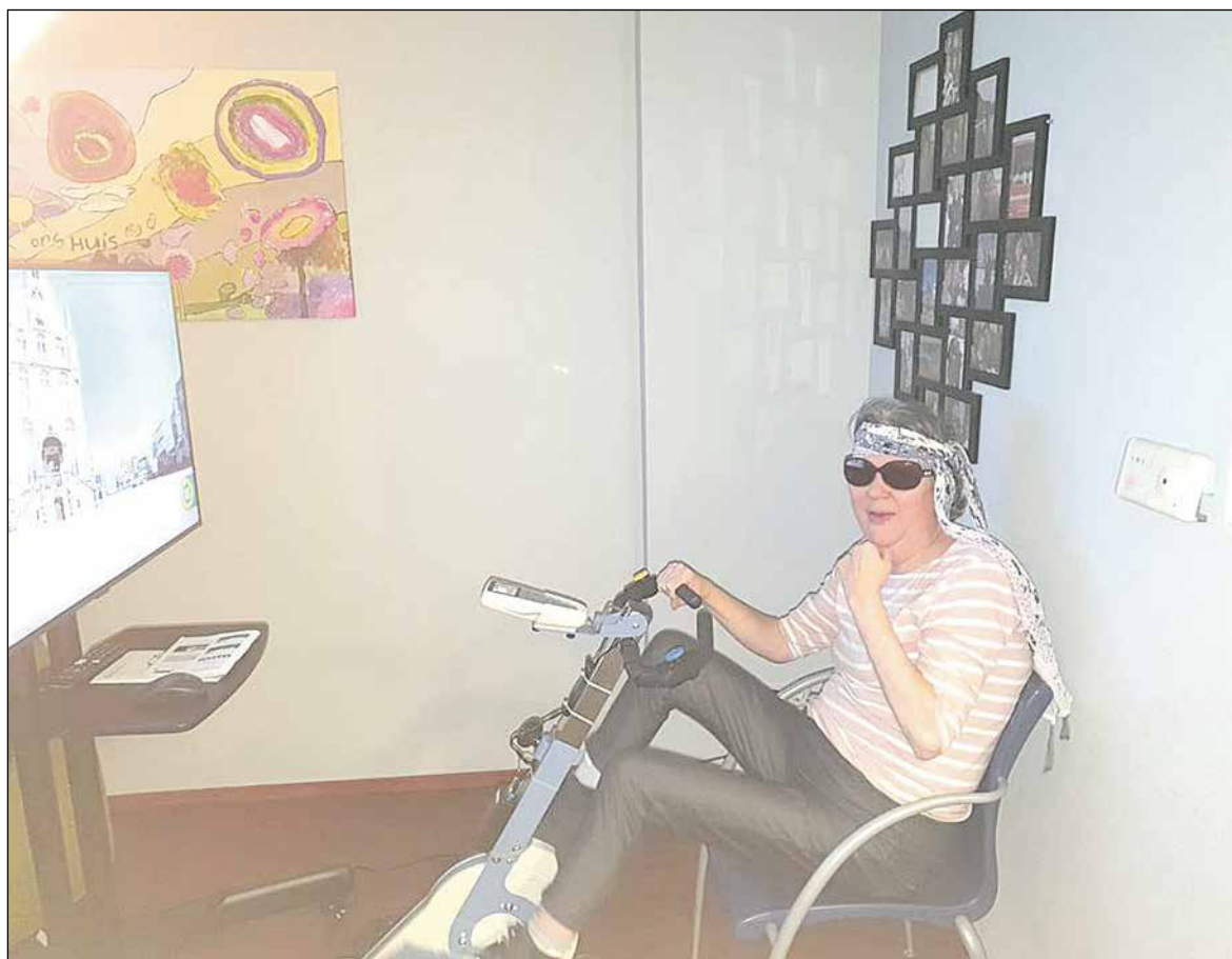
Het ziet er professioneel uit zo'n fietslabyrint!

Als u Korenmolen De Haas in Benthuisen een warm hart toedraagt en bereid bent ook een steentje bij te dragen om de molen een droge voet te bezorgen, neem dan een kijkje op de websitepagina www.molenfonds.nl/dehaas Daar staat informatie over het project en hoe u eenvoudig kunt doneren.