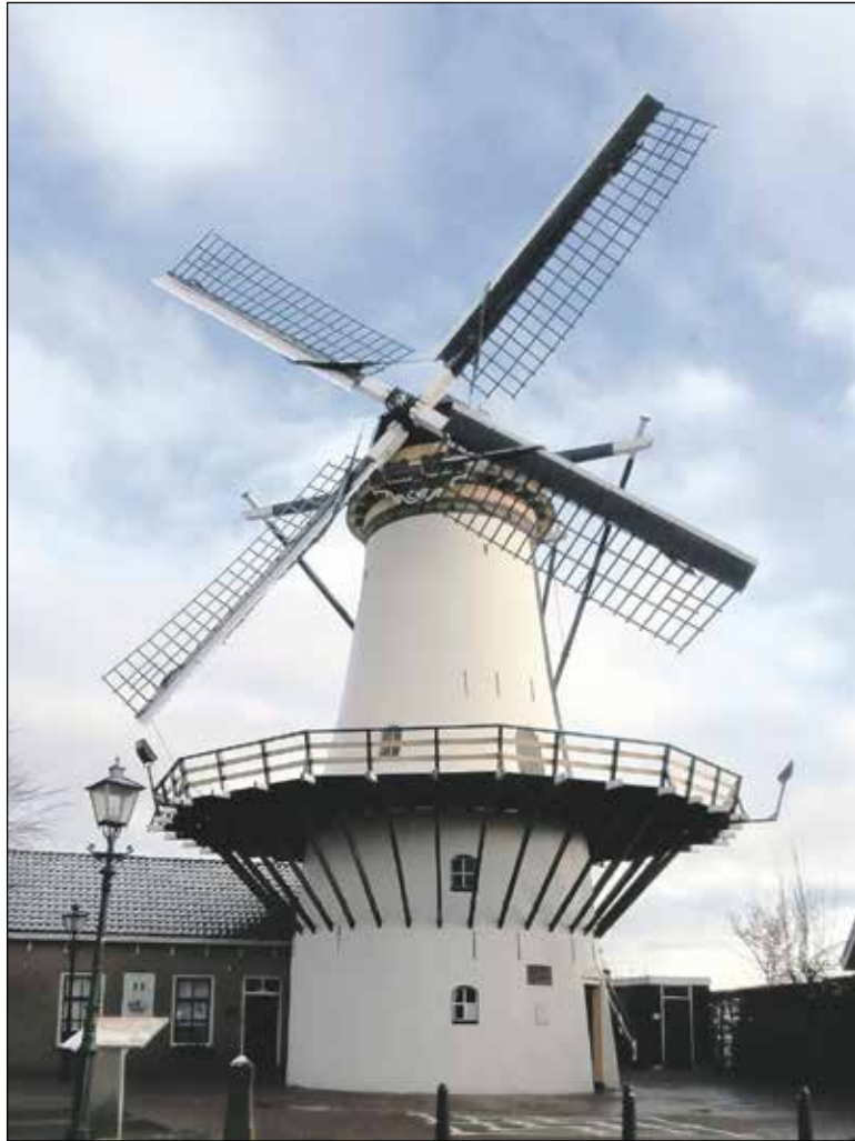
Molen de Haas

Om de actie te ondersteunen komt er in april een flyeractie in Benthuisen, worden bedrijven en omwonenden aangeschreven en wordt er in mei een beroep