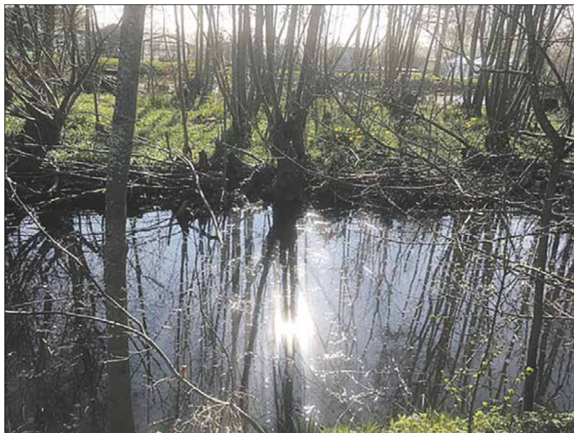
Een 'verstild' plekje aan de Lagewaard...

In ons artikel van vorige week (31 maart) over de voorgenomen Woningbouw in 'Het Oog van Koudekerk' stond vermeld: '... binnen een zone van 200 meter vanaf de Lagewaard niet gebouwd zal worden om vrij zicht over de weilanden te handhaven'. Door een aantal lezers is deze zin anders geïnterpreteerd dan de bedoeling was. Deze zin had aangevuld moeten worden met: "Zo is de afspraak van de gemeente met de inwoners Koudekerk aan den Rijn".