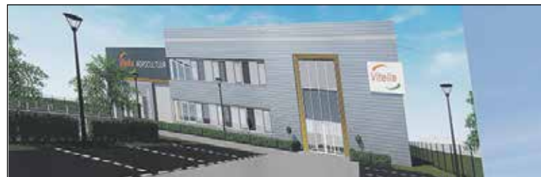
Impressie van het nieuwe pand

Vitelia kent meerdere vestigingen in Nederland. In het bedrijf in Hazerswoude werken twaalf medewerkers, die dagelijks direct contact hebben met hun klanten. Als alles volgens plan verloopt wordt de nieuwbouw in de loop van november van dit jaar opgeleverd en hoopt Vitelia vanaf januari 2022 vanuit het nieuwe pand haar klanten te bedienen.