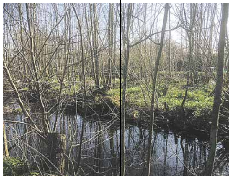
Het laatste stukje "echte" oude natuur in Koudekerk

In het dorp gonzen op dit moment veel positieve geluiden: Eindelijk gebeurt er iets. Er is hoop op woningbouw, maar hoe snel kan men aan de slag? De Woningbouwklok heeft lang, te lang, stil gestaan. Voor vele inwoners van Koudekerk staat de klok op het twee voor twaalf.