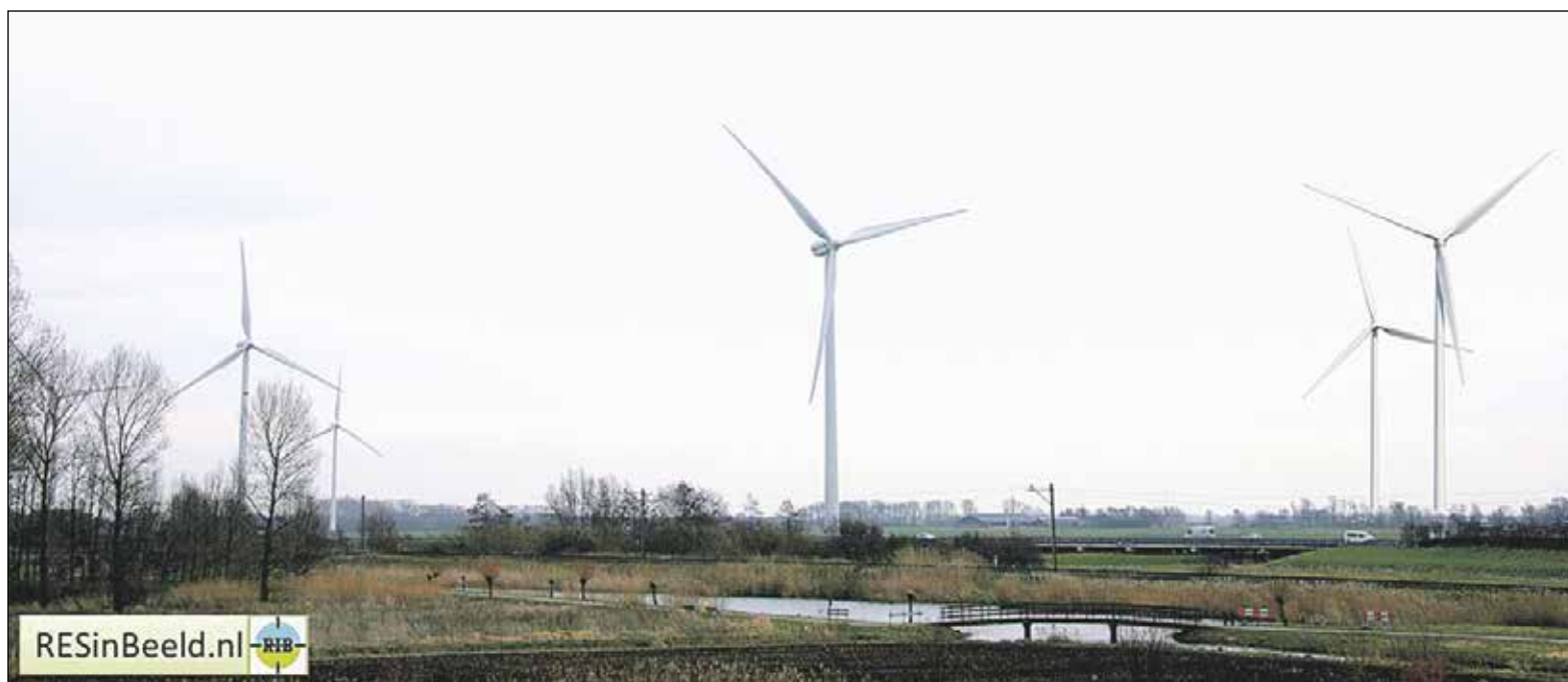
Een paar nieuwe windmolens ingetekend naast de reeds bestaande. Waarschijnlijk worden ze dubbel zo hoog als de "oude".

Alphen aan den Rijn is de gemeente met het grootste grond-