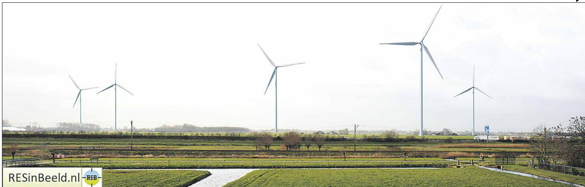
Visualisatie windmolens 2030 in zuidelijke richting. Zicht op Hazerswoude-Dorp van Rietveldse molen links naar Engelbewaarderskerk rechts