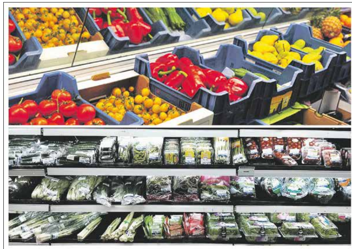
De keuze voor 'verpakt of onverpakt' ligt natuurlijk ook bij de consument zelf...

De Werkgroep Duurzaam Koudekerk wil in de eigen omgeving een steentje bijdragen aan een duurzamere samenleving. In de komende edities van deze rubriek vertellen Koudekerkse bedrijven over hoe zij bijdragen aan een beter milieu. Dit keer is supermarkt Albert Heijn Konincks aan de beurt.