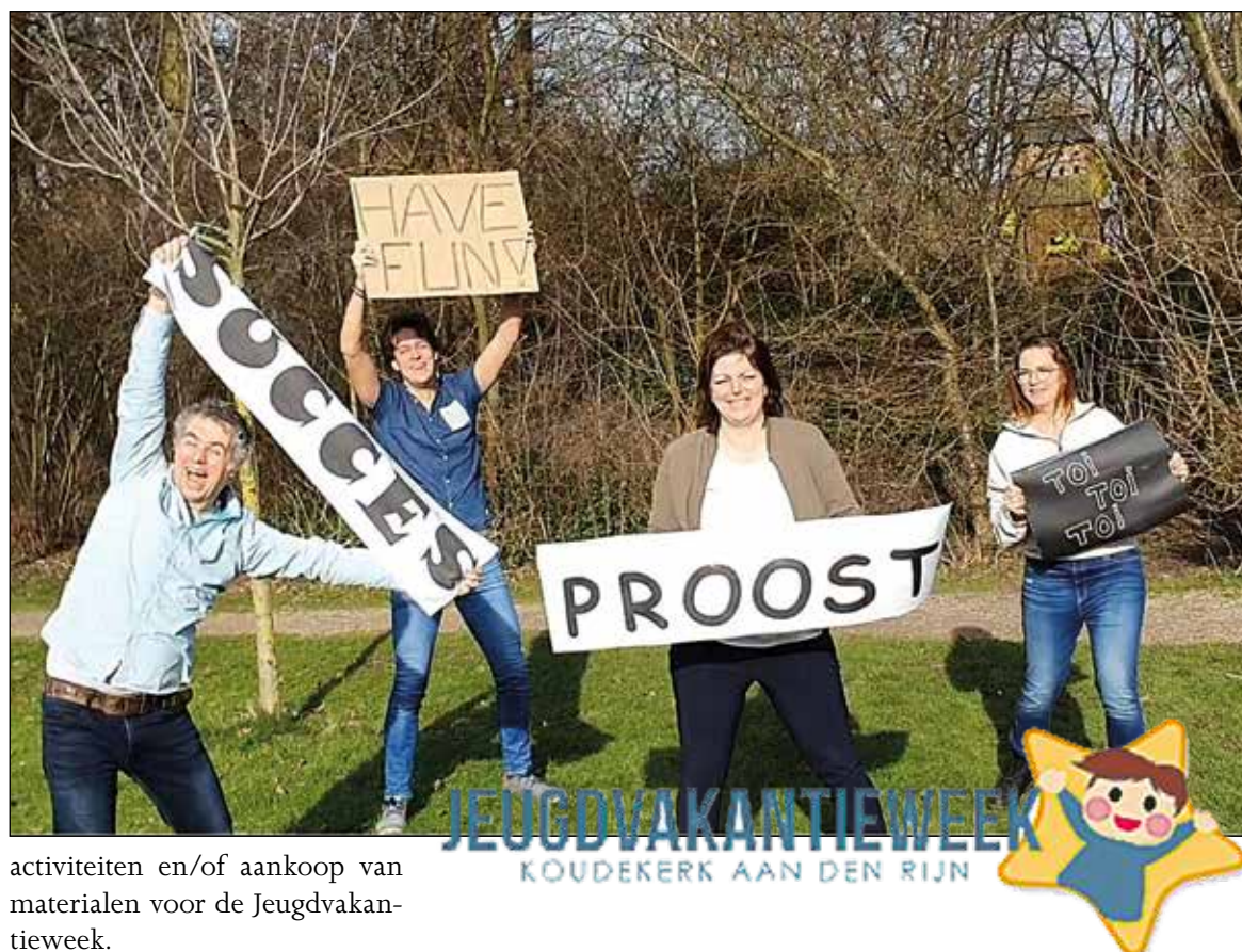
activiteiten en/of aankoop van materialen voor de Jeugdvakantie-week.

en Garage Goudkuil". Aansluitend wordt de loterijtrekking bekend gemaakt. Lokale ondernemers hebben hiervoor veel prijzen ter beschikking gesteld. Zo maken deelnemers kans op een jaar lang gratis brood van Van Kempen, de echte bakker en een waardecheque van Casba/ Trendhopper. De avond is van opzet weliswaar heel anders dan we voor ogen hadden, maar we zijn vastbesloten er een succes van te maken en de deelnemers een leuke avond te bezorgen. De opbrengst komt ten goede aan de organisatie van