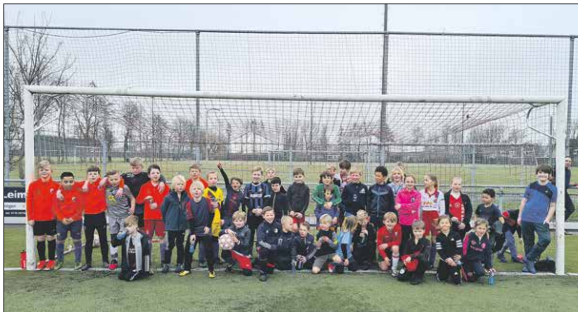
Alle deelnemers bij elkaar.