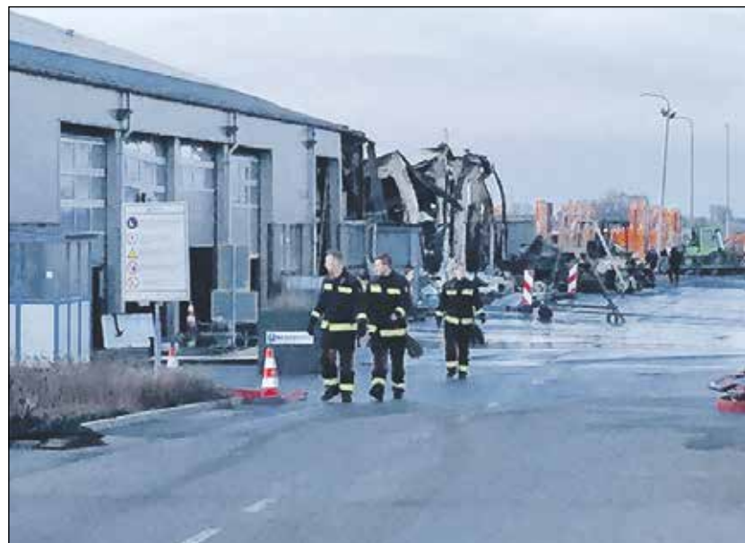
De ravage aan het einde van de dag

door een brandwerende muur van het achterste deel gescheiden. Uiteindelijk is het vuur toch via het dak in het voorste gedeelte terecht gekomen. De hele werkplaats, die gebruikt werd voor onderhoud is verloren gegaan.