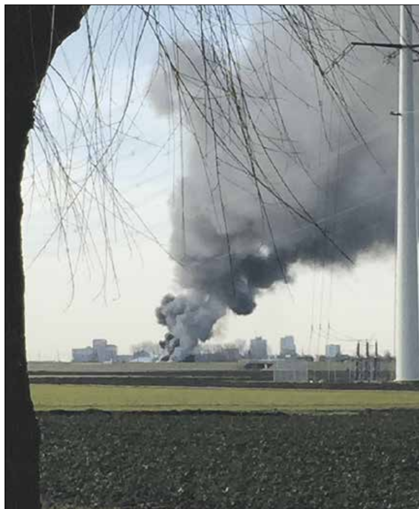
De rookkolom was van verre te zien!

Wilt u in deze lastige tijd nog een beetje plezier, Laat dan Uw maaltijden verzorgen door Café de Egelantier Dinsdag t/m zondag Iedere week zolang de crisis duurt open voor afhalen en bezorgen. Zie www.egelantier.com