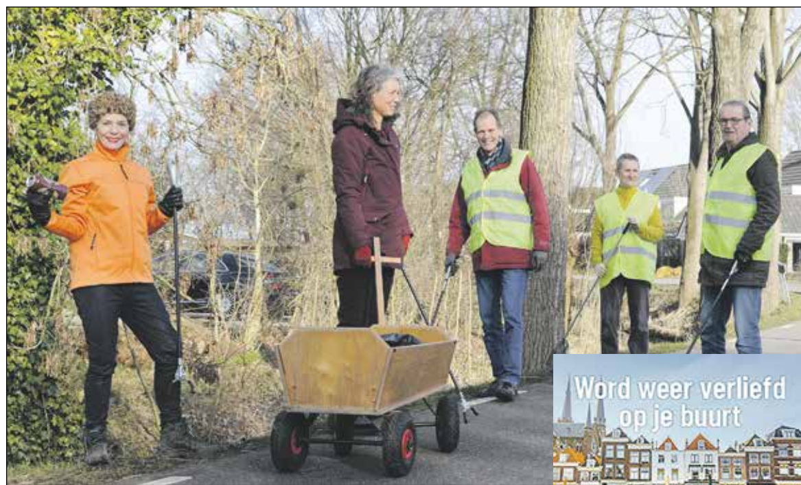
Werkgroep Duurzaam Koudekerk in actie.

Op zaterdag 20 februari stak de Werkgroep Duurzaam Koudekerk de handen uit de mouwen om zwerfafval te verzamelen aan de Lagewaard in Koudekerk. Deze actie leverde in twee uur tijd vier vuilniszakken met afval op dat niet meer te recycleren is.