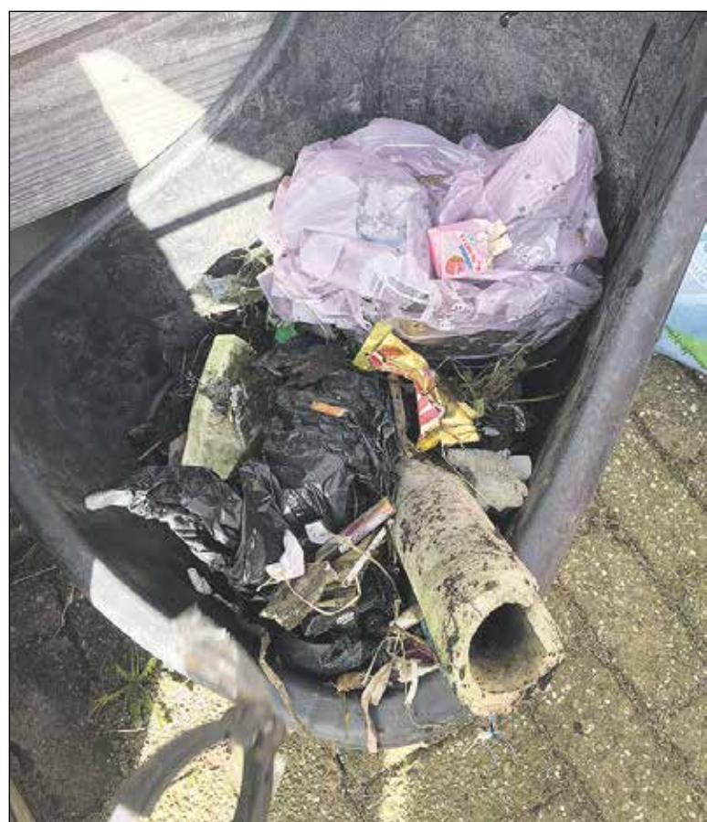
Een deel van de "oogst".

De 215 kringloopwinkels die aangesloten zijn bij de Branchevereniging voor Kringloopbedrijven (BKN) en het 100%Kringloop keurmerk hebben zijn non-profit bedrijven, die door middel van verkoop van tweedehands spullen bijdragen aan een duurzame planeet. Daarnaast bieden ze aan duizenden mensen werk- en leerplekken. Dit zijn veelal mensen die door een arbeidshandicap of psychische kwetsbaarheid het moeilijker hebben op de reguliere arbeidsmarkt