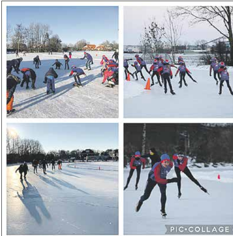
Ijspret voor velen!

Vooraf in het begin was het druk op de website van VIJK. De aanmeldingen kwamen voornamelijk uit Koudekerk en de omliggende dorpskernen van onze gemeente. Er melden zich zelfs weer oud-leden aan als lid; deze kwamen o.a. uit Amsterdam, Den Haag, Dordrecht, Driebergen, Gouda, Wassenaar, Leiden, Voorburg en enkele omliggende gemeentes. Waarom vraag je je af? Wel, ik denk de sfeer, de gezelligheid op het Koudekerkse ijs was in het verleden en ook nu wederom fantastisch! Een echte Dorpssfeer: iedereen kent bijna iedereen. Dit alles had tot gevolg dat het ledenlijst van VIJK 'uit z'n voegen barstte': maar liefst ruim 500 nieuwe leden kwamen er bij!! Natuurlijk hoopt men bij VIJK dat deze toetreders ook straks lid blijven.