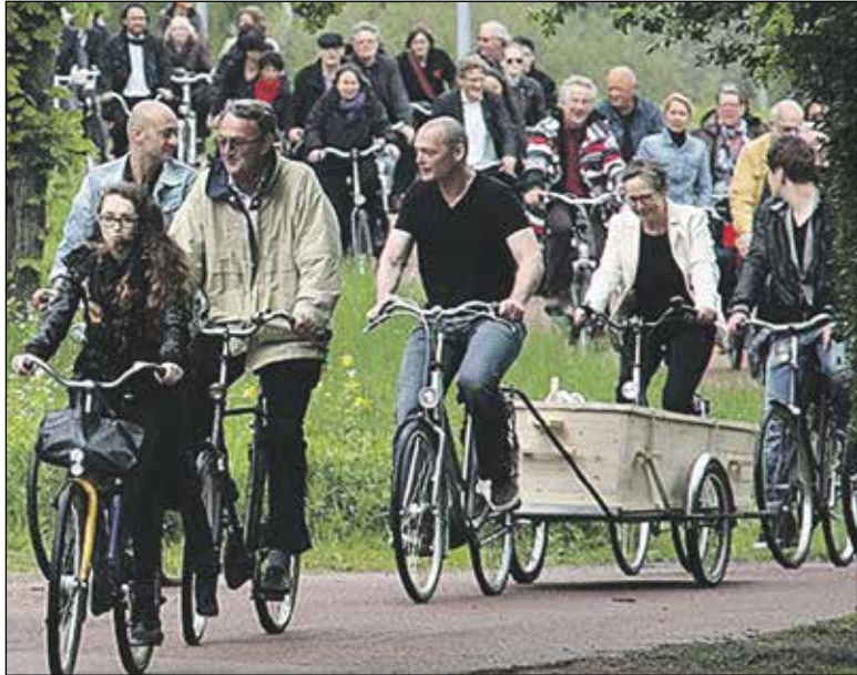
Voorbeeld van een duurzame uitvaart

De Werkgroep Duurzaam Koudekerk wil in de eigen omgeving een steentje bijdragen aan een duurzamere samenleving. In de komende edities van deze rubriek vertellen Koudekerkse bedrijven over hoe zij bijdragen aan een beter milieu.