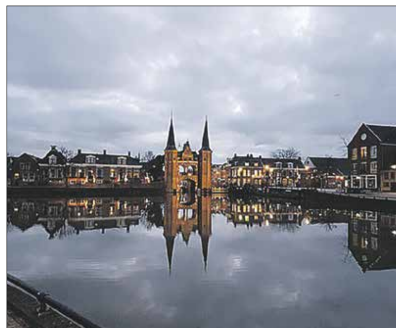
De beroemde Sneker Waterpoort in duplo.

De alternatieve Winterfietselfstedentocht is er voor 225 km is er voor de échte doorzetters