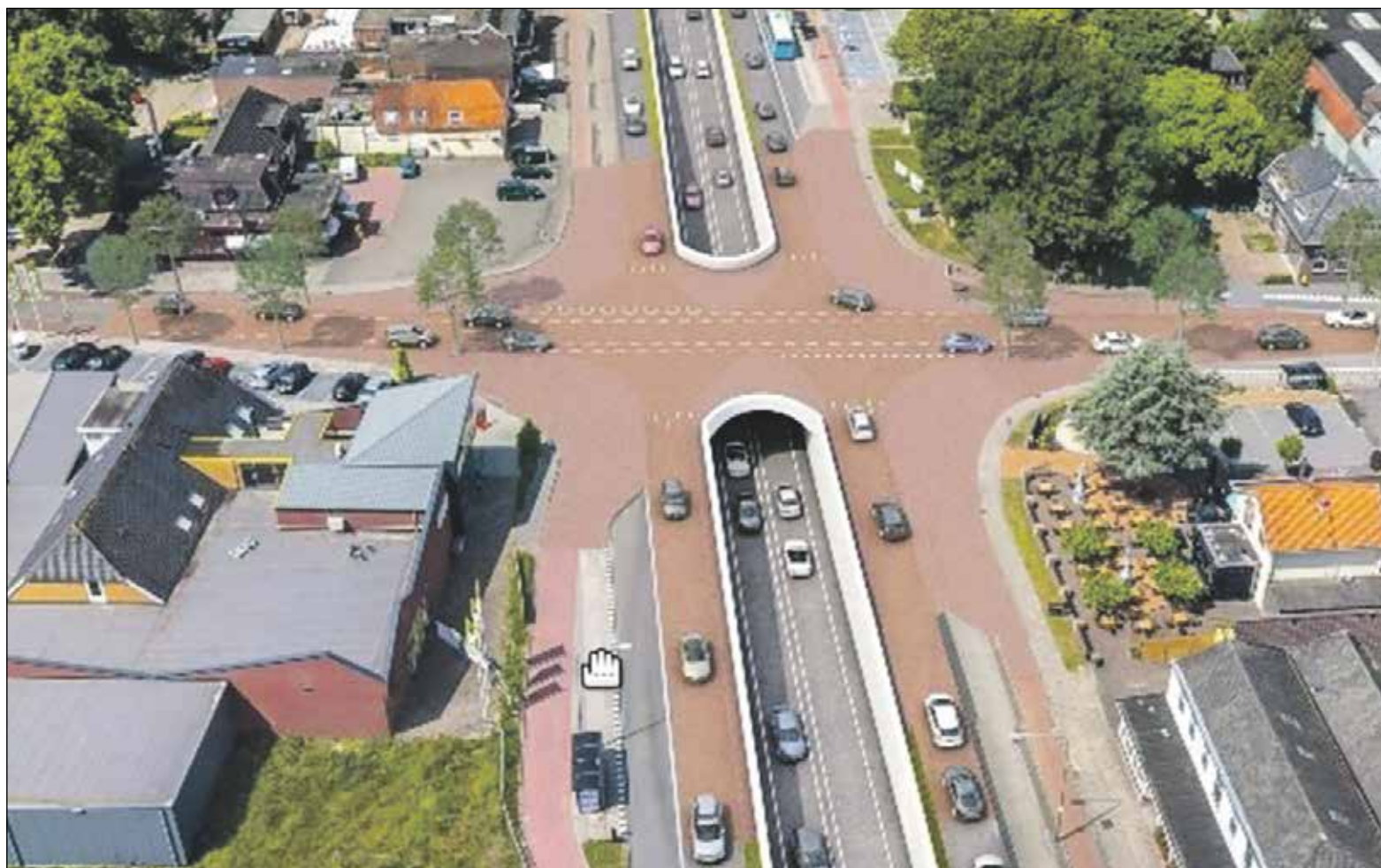
Voorbeeld van een tunnelplan in Balkbrug (Overijssel). Veel inwoners van Hazerswoude vinden dit plan een goed voorbeeld voor hun dorp

De maatregelen die de gemeente Alphen heeft aangekondigd voor het kruispunt van de Dorpsstraat met de Gemeneweg en de ontsluitingsweg rond de wijk Weidelanden, zit bij veel inwoners hoog. Maar liefst 17 insprekers meldten zich bij de (digitale) commissievergadering afgelopen week om duidelijk te maken hoe zij hierover denken.