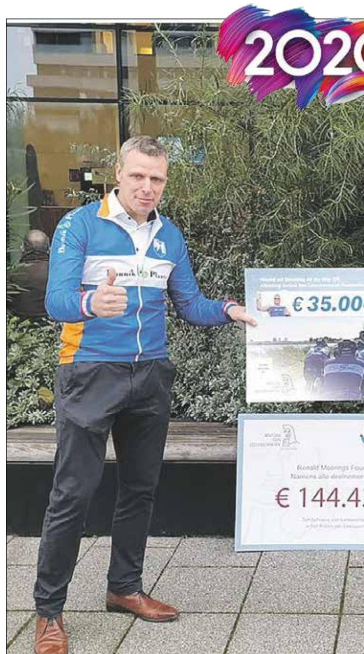
Ze hebben het weer gedaan, de mannen van 'All the Way EFT'. kankeronderzoek met een fietstocht van 580 kilometer in 3 da...