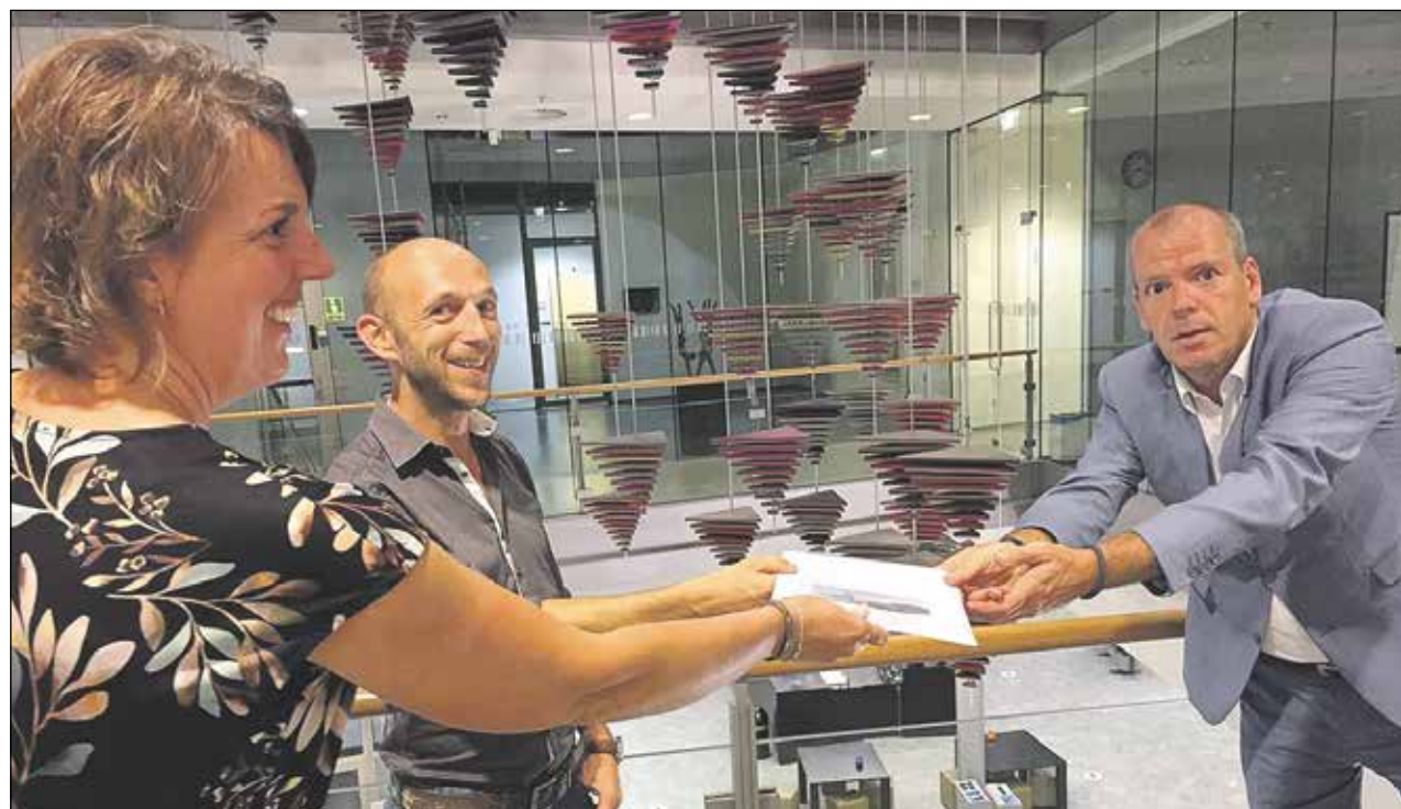
Uit de door het Dorpsoverleg van Groenendijk (Hazerswoude-Rijndijk West) gehouden enquête blijkt dat de inwoners dik tevreden zijn over hun leefomgeving. Natuurlijk staan er ook wat wensen op het lijstje zoals terugbrengen van verdwenen voorzieningen.