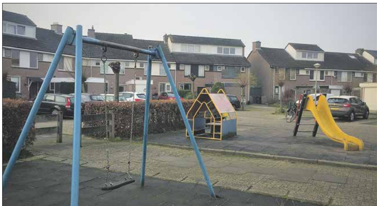
In december was het zover, het speeltuinenbeleid van de gemeente is goedgekeurd. Eerder in het jaar kwamen bewoners van onder andere de Marsstraat en de Mozartlaan in Hazerswoude-Rijndijk in opstand tegen de gemeente die zomaar speeltuinen wilde verwijderen. Na overleg met omwonenden over de behoefte aan speelplekken blijven nu meer speeltuinen behouden.