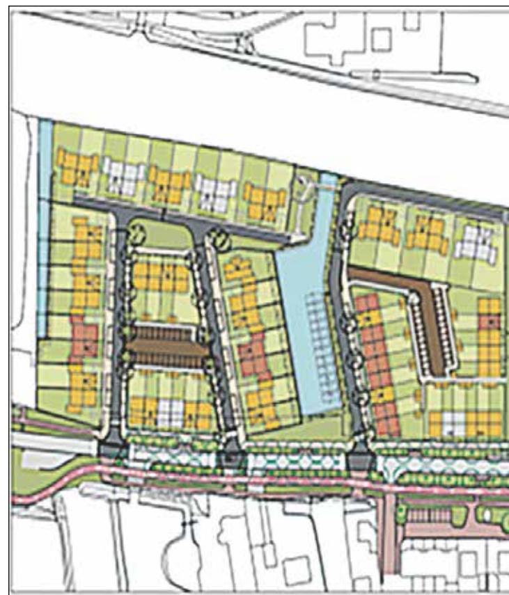
Het bestemmingsplan voor de wijk Nieuw Rijn met ruim 100 v... teraad goedgekeurd. Dat ging niet zonder slag of stoot, want de... kers hebben gevochten: de 5,6 meter hoge geluidswal is gesneu... latie. Of wordt Pleyn68 toch afgebroken en elders opnieuw gel...