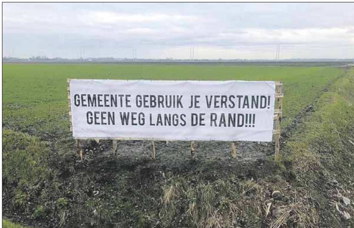
Met grote spandoeken in de weilanden wordt aandacht gevraagd!

Bewoners Overleg Plan Zuid (BOPZ) in Hazerswoude-Dorp gaan donderdag 28 januari een petitie aanbieden aan de wethouder van verkeer. Zij maken zich zorgen om de voorgenomen verkeersmaatregelen in het zuidwesten van het dorp.