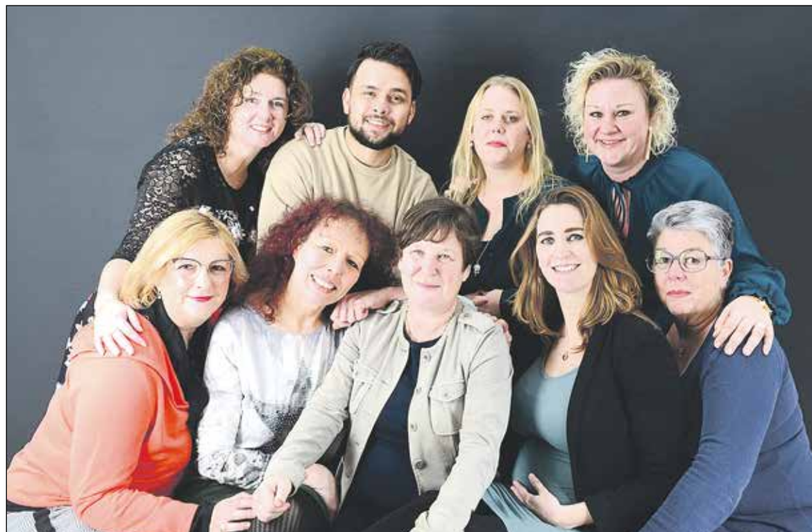
Het team van "Tom in de Buurt"