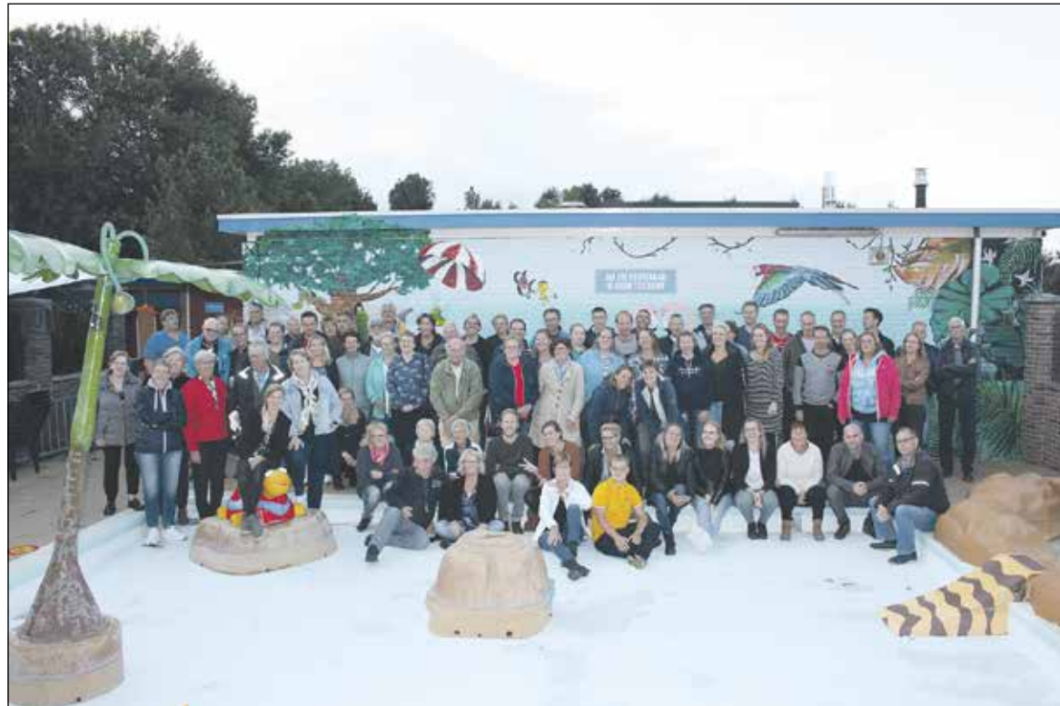
Met z'n allen is en wordt er keihard gewerkt aan het nieuwe seizoen!

De planning is dat zwembad De Hazelaar in Hazerswoude-Dorp op zaterdag 25 april opengaat, maar of dat ook gaat gebeuren????