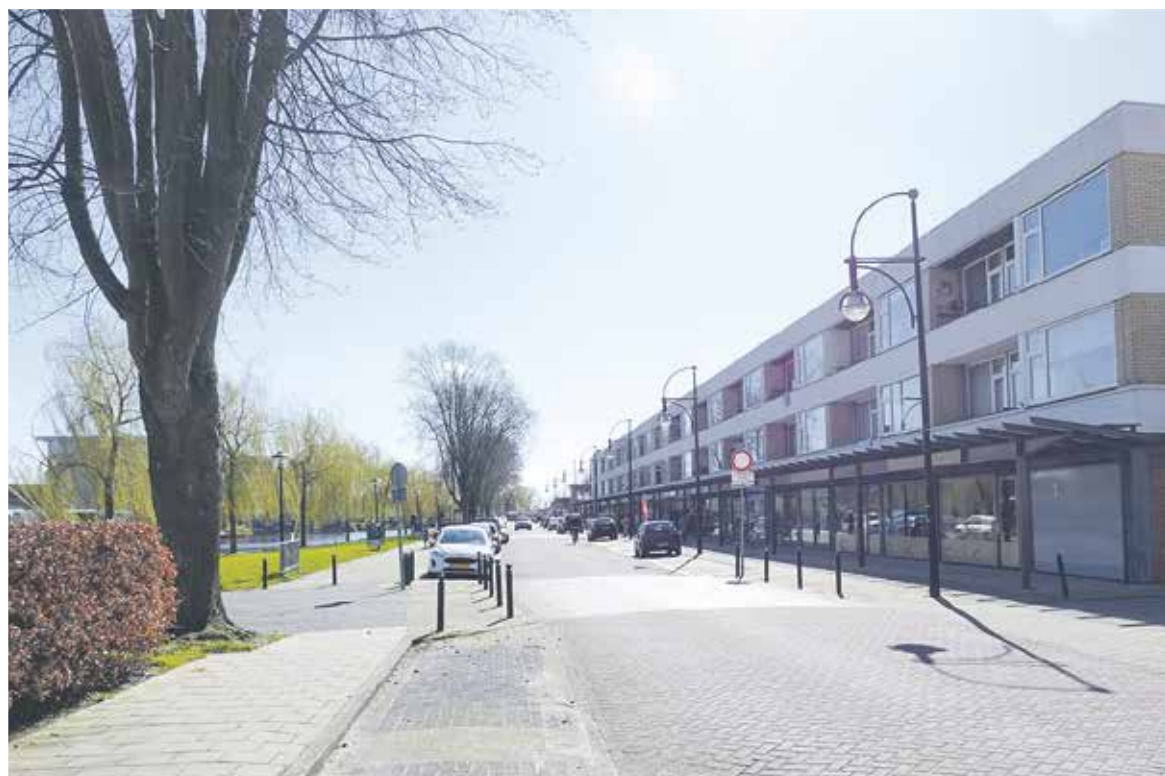
Een lege Da Costasingel.